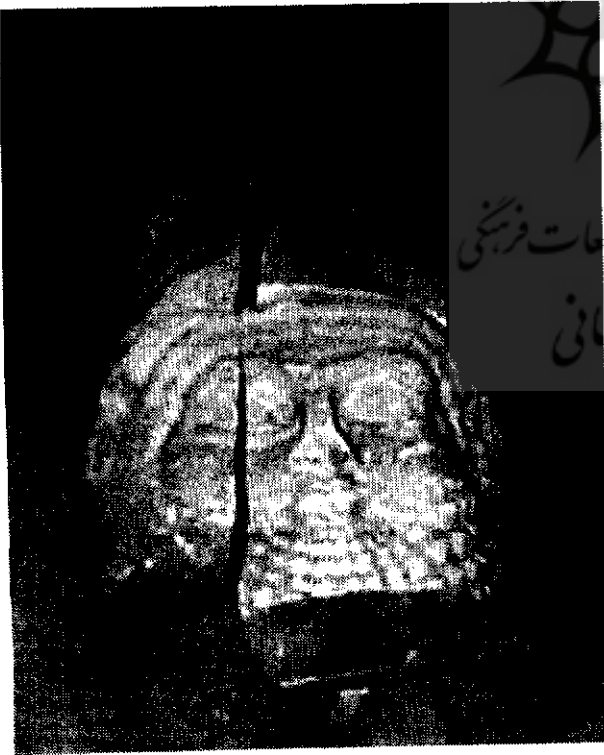
عکس ۸: این سر تراشیده شده که خوشبختانه توسط مقامات عراق پیدا شد، از یکی از بناهای باستانی عراق به سرقت رفته و سپس به قطعاتی تقسیم شده بود تا از طریق غیرقانونی به خارج صادر شود.

یونسکو در سال های پس از جنگ اول خلیج فارس برای بازسازی اماکن باستانی عراق مساعدت هایی نمود. این سازمان در مارس ۱۹۹۵ بیانیه ای مطبوعاتی منتشر کرد تا به جماعت موزه ها، کلیکسونرها و تجار هنری نسبت به فروش اشیای باستانی به سرقت رفته از عراق هشدار دهد. هم چنین در اول ماه می ۱۹۹۵، سندی مرتبط با برخی از اشیای کم شده که شامل تصاویر و شرح کامل آنها می شد منتشر کرد. بازسازی قصر العباسی در سال ۱۹۹۹ و تعویض سیستم تهویه هوای موزه ملی بغداد و افزودن یک سیستم