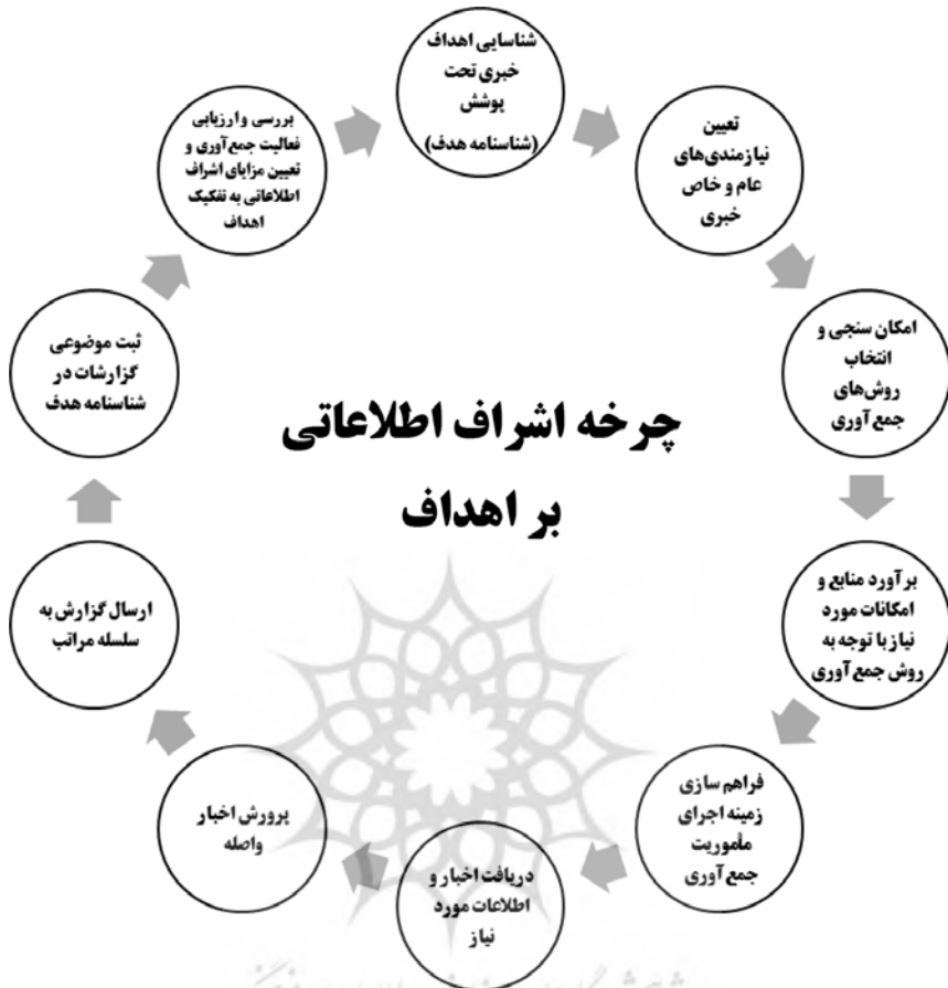
شکل ۱: چرخه اشراف اطلاعاتی بر اهداف (جمشیدیان، ۱۳۸۹: ۳۷)