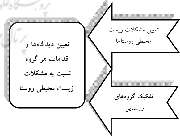
ن 1. مدل مفهومی تحقیق.

این مقاله با توجه به مدل مفهومی (نمودار شماره 1)، ابتدا به دنبال تعیین مشکلات زیست محیطی موجود در روستاها بوده و سپس با تفکیک روستائیان به گروه‌های متفاوت، نگرش هر کدام از این گروه‌ها را نسبت به اهمیت حفاظت از محیط زیست از طریق توجه و اقدامات آنها در برخورد با این مشکلات بررسی کرده است.