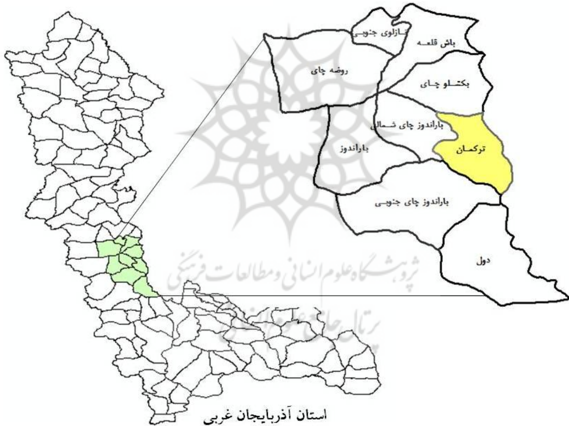
ت 1. محدوده دهستان مورد مطالعه.

زیست تکمیل شده و پایایی پرسشنامه نیز 0,94 می‌باشد. نمونه مربوط به مدیران از کل دهستان‌های محدوده انتخاب شده است. (نمودار شماره 2) متغیرها و مؤلفه‌های مورد استفاده در پرسشنامه را نشان می‌دهد. برای تعیین پایایی پرسشنامه از روش سازگاری درونی ابزار اندازه‌گیری استفاده شده است، که با ضریب آلفای کرونباخ اندازه‌گیری می‌شود. مقدار این ضریب در نرم‌افزار SPSS محاسبه شده است. سوالات پرسشنامه در دو بخش نگرش و اقدامات و در قالب طیف لیکرت بوده و نتایج از طریق تحلیل واریانس یک طرفه تحلیل شده‌اند.