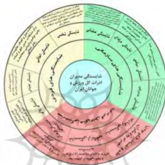
شکل ۳- الگوی نهایی شایستگی‌های مدیران ادارات کل ورزش و جوانان ایران

در نهایت، الگوی شایستگی مدیران ادارات کل ورزش و جوانان به صورت زیر ارائه می‌گردد.