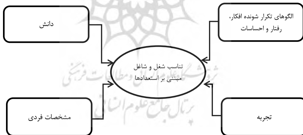
شکل ۱: مدل مفهومی تناسب شغل و شاغل مبتنی بر استعدادها

در این پژوهش با توجه به مطالعات انجام شده و با نظر اساتید راهنما و مشاور، و همچنین وجود ابزار سنجش و اطلاعات مورد نیاز در مرکز آمار ایران، تناسب شغل و شاغل مبتنی بر استعدادها، از ۴ منظر مورد بررسی و سنجش قرار گرفته است. اول استعداد به عنوان الگوهای تکرار شونده افکار، رفتار و احساسات ( , Buckingham & Vosburgh , 2001 , 2008) ، استعداد به عنوان دانش ( Bethke , 2001 , 2008) ، Cheese, Thomas and Craig , 2008) ، استعداد به عنوان تجربه ( Tansley et al. , 2006) ، استعداد به عنوان مشخصات فردی ( Lewis & Heckman , 2006) . شکل ۱. مدل مفهومی این پژوهش را نشان می دهد. جدول ۴. نیز معیارهای سنجش تناسب شغل و شاغل را به همراه منابع مربوطه و ابزار سنجش، معرفی می نماید.