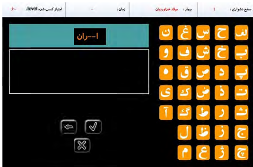
تصویر ۱- نمونه‌ای از تمرینات جهت تقویت حافظه آینده‌نگر

سطح (ب) عدم تشویق حدس زدن و استفاده از روش آزمایش و خطا (ج) ندادن فرصت اشتباه به فرد با دادن سرخ‌های بیشتر برای بازیابی تا رسیدن به پاسخ درست (د) ارائه نمونه و مثال‌های کافی قبل از اینکه از فرد خواسته شود تکلیف اصلی را انجام دهد (و) تصحیح فوری خطاها.