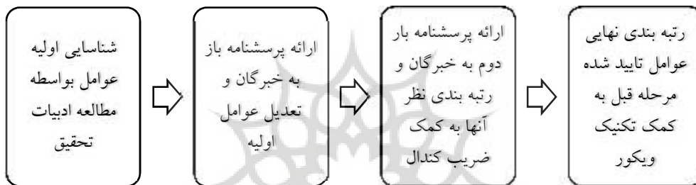
شکل شماره ۱: مدل مفهومی تحقیق