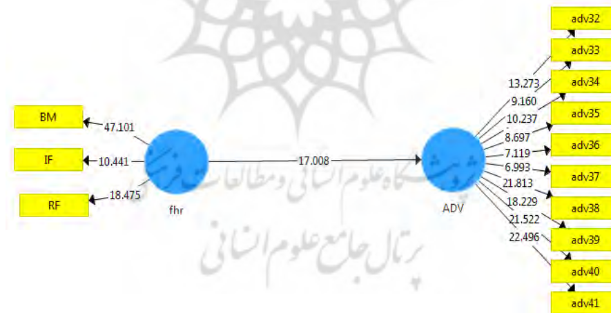
شکل ۲. عدد معنی‌داری فرضیه اصلی

پس از برازش مدل‌های اندازه‌گیری، مدل ساختاری و مدل کلی، محقق اجازه می‌یابد که به بررسی و آزمون فرضیه‌های تحقیق خود پرداخته و به یافته‌های پژوهش دست یابد (داوری و رضازاده، ۱۳۹۲). این کار در دو بخش بررسی ضرایب معنی‌داری (t) و ضرایب مسیر (B)، صورت می‌گیرد. وقتی مقدار t آماری برای آزمون یک فرضیه در سطح ۰/۰۵ بالاتر از حداقل ۱/۹۶ باشد، فرضیه تأیید می‌شود. ضریب مسیر نیز نشان‌دهنده اثر مستقیم یک سازه بر سازه دیگر است. هر اندازه این ضریب مسیر بالاتر باشد، تأثیر پیش‌بینی‌کننده متغیر پنهان نسبت به متغیر وابسته بیشتر خواهد بود. نتایج هر یک از فرضیه‌ها در قالب دو مدل موجود در جدول ۵، ارائه شده است. این جدول مبین دو مدل (شکل ۲ و ۳)، است. مدل ۲، فرضیه اصلی و مدل ۳ فرضیه‌های فرعی را نشان می‌دهد.