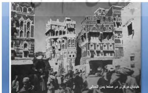
شکل ۶- خیابان مرکزی در صنعا یمن شمالی

بعضی از سبک های معماری خاک تا حدودی به راحتی قابل کاربرد است، همین امر سبب بهره جستن ساکنین به شکل جزئی یا کلی از آنها می شود. دیوارها معمولاً "باندودی" - که خود نیز از جنس خاک است محافظت میشود: این روکش باعث یکدست شدن و استحکام بنامی شود. نمای بیرونی ساختمان - که مرسوم است بعد از هر فصل بارانی بازسازی می شود - به فرمهای بی شماری تغییر می کند : قدرت آفرینش هر کسی می تواند به دیوارها غنایی بصری، لمسی و حسی ببخشد. در ساخت و ساز با خاک آفرینش های معماری و هنری به طور کامل به هم می آمیزند. آرایه ها و دیوارها از نظر جنس با وحدتی کامل با هم ارتباط می یابند . این آرایه ها از هنر معماری و همچنین از مردم صاحب آن سبک ها جدایی ناپذیر است. (محمود توسلی، ۱۳۶۰)