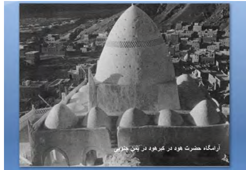
شکل ۳- آرامگاه حضرت هود در کبره‌هود در یمن جنوبی

های مختلف هنرهای ملی را به همراه آورد. امروزه وظیفه ما باز جستن این میراث است ولی این امر با حسرت خوردن میسر نمی شود، بلکه باید بتوانیم پیوستاری بین سنت ها آینده ایجاد کنیم، آینده ای که اجازه ی ظهور دوبارهاین ویژگی های فرهنگی و توانایی های محلی را فراهم کند. (ابراهیم جعفرپور، ۱۳۶۷)