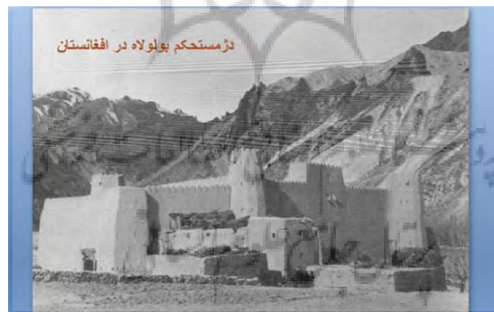
شکل ۲- ساختمان حکومتی بولولاه در افغانستان

هر چند که همگان نیز در باز شناسی سنن تاریخی و مردمی معماری با خاک اذعان به دیرینگی داشته باشند باز برخی عقاید واهی بر این باور وجود دارد بناهای گلی سستی و در برابر گذر ایام مانایی و پایداری چندانی ندارد. با مطالعه دقیق بر روی باقیمانده های میراث کهن در سراسر دنیا، خلاف این مسأله اثبات میشود. تنها در چنین شرایطی است که ما می توانیم امروزه در جنوب شرقی ایالت متحده، کلیساها و صومعه های بی شماری را ببینیم که در قرن شانزدهم از گل ساخته شده است؛ در آفریقای سیاه نیز مساجد بزرگی وجود دارد که تاریخ ساخت آنها تقریباً به همان زمان میرسد. باورهای عظیم دفاعی که در قرن دوازدهم در اطراف بسیاری از شهرهای آفریقا (مراکش، فس، رباط) جنوب اروپا و خاورمیانه بنا شده است حاکی از استحکامی است که بناهای گلی می توانند داشته باشند. دروازه ی باروی باب الادریس در الشهر در یمن جنوبی از همین رو در قرن سوم قبل از میلاد امپراتوران چین با استفاده از این فنون دیوار معروف چین را ساختند. متخصصین لشکری بسیاری از سپاه ها از ویژگی استحکام گل خام بسیار بهره جسته اند: چه در اسپانیا در قرن دوم پیش از میلاد توسط هانیبال و چه توسط ارتش آمریکا در سال ۱۹۴۳ برای ساخت سدها، ساختمان ها و بناهای پرواز. از آن زمان تا کنون پیشرفت های فنی جدید باعث ارتقای این شیوه سنتی شده است. (محمد کریم پیرنیا، ۱۳۷۱)