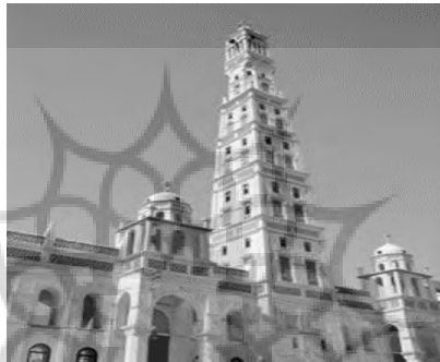
شکل ۷- برج بابل

آیا اولین (آسمان خراش) تاریخ ما از گل ساخته شد؟ تحقیقات اخیر باستان شناسانشان می‌دهد که (برج) معروف (بابل) در قرن هفتم ما قبل تاریخ در مرکز بابل با استفاده از این مصالح ساخته شده است. به نظر می‌رسد که ارتفاع آن تا طبقه هفتم به نود متر می‌رسیده است. در شهرهای متعددی در بین النهرین (زیگورات‌های) پلکانی وسیعی دیده می‌شود که ارتفاع آنها تا چهل یا پنجاه متر بوده است. این سنت‌های تاریخی از طریق سنت‌های مردمی که از خاک برای ساخت بناهای مرتفع خود بهره می‌جسته‌اند، هروزه به دست ما رسیده است. بناهای موجود در دره‌ها، قبل از صحرایان در مراکش ویا قصرهای آن محل (کسبه‌ها) هنوز تا چهار طبقه ساخته می‌شود: در روستاهای سرخ پوستی امریکای شمالی و تائوس نیز وضع به همین منوال است. مناره‌های بلند مساجد در افریقا و خاورمیانه گویی جاذبه‌ی زمین را به تمسخر گرفته‌اند. از بین تمامی شهرهای ساخته شده از خاک در سراسر دنیا شهر شیپام در یمن شمالی به واسطه‌ی چیره دستی و مهارتی که در ساخت آن به کار رفته است از شگفت‌انگیزترین آنها به شمار می‌رود. گاهی اوقات آن را (منهتن صحرا) نیز می‌نامند، زیرا با تعداد پانصد ساختمان مانند جنگلی از آسمان خراش به نظر می‌رسد: این ساختمان‌ها ارتفاعی تا سی متر و هشت طبقه دارند. درست است که این سنت شهرسازی یمنی قدیمی است، ولی بیش از نیمی از آنها در قرن بیست ساخته شده است. این مساله نشان می‌دهد که مهارت شهرسازی موجود در یمن توانایی سازگاری با شهرسازی معاصر را دارد. (آرتور پوپ، ۱۳۶۵)