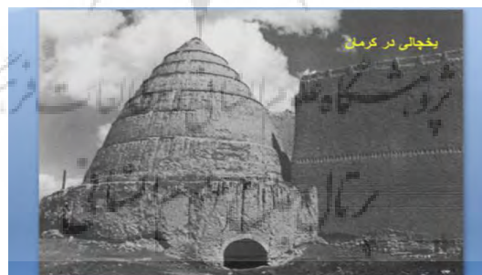
شکل ۴- یخچالی در شهر کرمان

در طول نیم قرن همه ی شرایط فرهنگی در جهت ترویج اصول خشک معماری نوین بود چنان که اغلب فراموش کردیم که معماری ملل سنتی چه قابلیت هایی در رفع مشکل مسکن به شیوه های محلی و خود جوش دارد. هنگامی که امروزه سخن از معماری با خاک می رانیم تصاویر «کلبه های ابتدایی» و کلیشه ی «خانه های دور افتاده و محقر» به ذهن همگان متبادر می شود. اما واقعیت های موجود با این تفکرات قشری وقوم مدارانه کاملاً فرق دارد. خانه های گلی ساخته شده در سراسر دنیا از تنوع بسیار، مهارت فنی در ساخت و نبوغ هنری برخوردار هستند. علاوه بر ساخت خانه، این مصالح قابلیت ساخت گستره ی متنوعی از ساختمانهای وسیع و کارآمد، عمومی و خصوصی، برای پیشرفت های معنوی و مادی جوامع شهری و روستایی را داراست: مساجد و کلیساها، سیلوها و انبارها، باروها و قلعه ها، آسیاب ها، آبراهه ها و یخچال ها، میدان ها، دروازه های با شکوه، معابد و قصرها از این مجموعه ها است. (لئونارد بنه ولو، ۱۳۵۳)