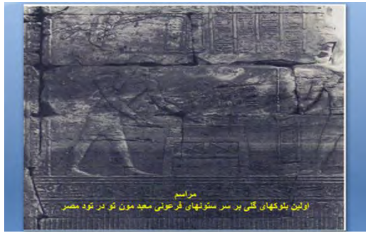
شکل ۱- اولین بلوک های گلی بر سرستونهای معبد فرعون مصر