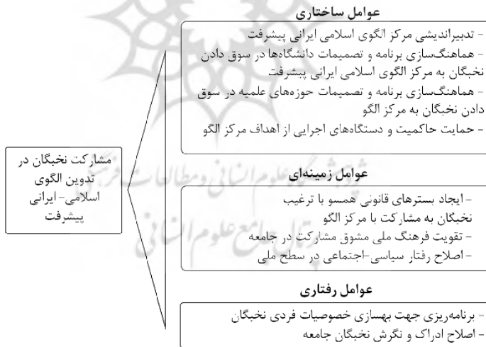
شکل ۲- جایگذاری طبقات اصلی در الگوی سه شاخگی

شکل ۱- الگوی پارادایمی عوامل مؤثر بر مشارکت نخبگان در تدوین الگوی اسلامی ایرانی پیشرفت تطبیق طبقات اصلی با الگوی سه شاخگی: از نگاهی دیگر و بر اساس یافته‌های مصاحبه و تعاملات صورت گرفته با استادان مصاحبه‌شونده و پس از اعتبارسنجی و اعمال اصلاحات، عوامل مؤثر بر مشارکت نخبگان در طراحی الگوی اسلامی-ایرانی پیشرفت طبق نظریه سه شاخگی به شکل زیر بازطراحی شد.