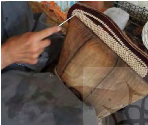
تصویر ۱۴- قرار دادن تخت گیوه در آجیده،

چرم که به‌وسیله گزن برش داده شده (تصویر ۱۳)، استفاده می‌شود و با سریش به هم می‌چسبانند و با مشته می‌کوبند و بعد از یک شبانه‌روز تحت فشار قرار دادن، آن را آجیده می‌کنند. به این ترتیب که ابتدا کف چرم را در جریده که به‌عنوان پایه‌ای برای ثابت نگه‌داشتن تخت گیوه در حین کار استفاده می‌شود، قرار می‌دهند (تصویر ۱۴) و سپس تمام قسمت‌های چرم، به‌غیر از حاشیه آن را با درفش سوراخ می‌کنند. این قسمت توسط پرگار مشخص می‌شود. نخ را از این سوراخ‌ها عبور می‌دهند به صورتی که در هر تخت گیوه حدود ۶۰۰ بار عبور نخ و سوزن مشاهده می‌شود؛ بنابراین تمام سطح تخت به‌جز حاشیه آن آجیده می‌شود (تصویر ۱۵).