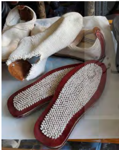
تصویر ۱۵- تخت گیوه آجیده