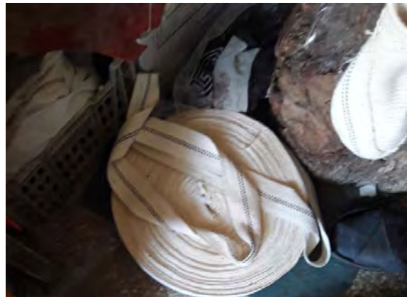
تصویر ۱۰- نوار،