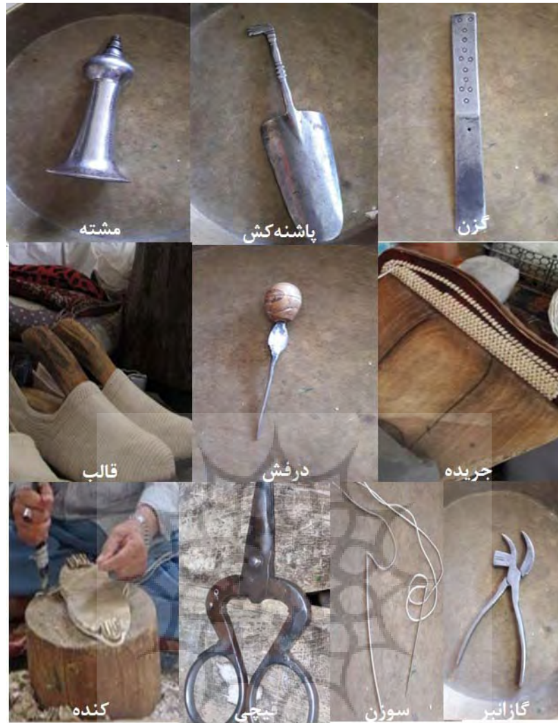
تصویر ۵: ابزار گیوه‌دوزی در سنجان، مأخذ: نگارنده.

۹- اصطلاحات گیوه‌بافی در شهرستان سنجان جوراب بندی (تولید گیوه)، آجیدن (دوختن نخ پنبه بر سطح چرم تمام قسمت‌های تخت گیوه به جز حاشیه آن)، ورچیدن (بافتن قسمت جوراب گیوه)، تکه دست گرفتن (ایجاد گره یا نخ و سوزن و جوال‌دوز برای شروع بافت رویه گیوه)، تال کردن (عبور دادن نخ از جوال‌دوز یا سوزن)، تخت (کف چرمی گیوه که زیر پا قرار می‌گیرد).