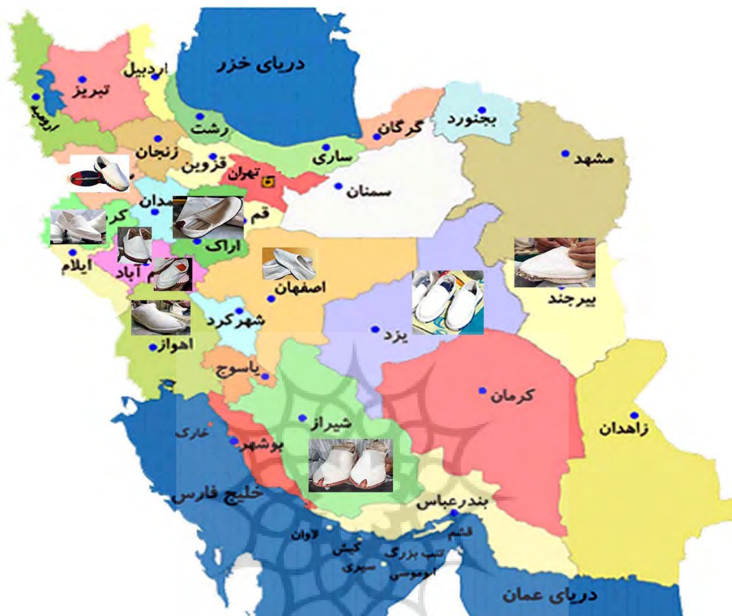
نقشه ۱: نقشه ایران با برخی از مناطقی که در آن‌ها گیوه‌بافی وجود دارد.

توجه به کشف سکه‌های تاریخی (مربوط به دوره قراقویونلوها) در آن و وجود دو امامزاده قدیمی در آن بیش از هزار سال تخمین زده می‌شود.