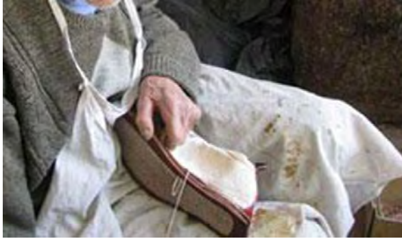
تصویر ۱۶- اتصال رویه به تخت گیوه