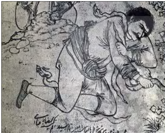
تصویر ۲: مارگیر با پای‌پوش گیوه، رضا عباسی، مکتب اصفهان، ۱۰۱۰ ه.ق. مأخذ: خزایی، ۱۳۶۸: ۲۷۳

در لغت‌نامه دهخدا در رابطه با واژه گیوه این‌گونه آمده است: «بافتی پر گره است که رویه آن از ریسمان پنبه بافته است و قسمت زیرین آن از چرم یا لته‌های درهم فشرده و درهم کشیده ساخته می‌شود». (دهخدا، ۱۳۷۷: ذیل واژه گیوه) در فرهنگ عمید (۱۳۸۱) هم از گیوه به‌عنوان کفشی که رویه آن از ابریشم یا نخ و زیر آن از چرم یا پارچه بوده، یاد شده است. در برهان قاطع آمده است که گیوه نوعی پای افزار است که رویه آن از ریسمان و نخ پرک است و زیره آن از چرم و بیشتر از لته‌های به هم فشرده و درهم کشیده ساخته شده است. نوعی کفش است که آن را کفش جامگی نیز می‌گویند. واژه گیوه در کتاب شیراز نامه، تألیف ابوالعباس زرکوب شیرازی، مربوط به پیش از ۷۵۴ ه.ق بدین گونه آورده شده است: «به شهور سنه ثلاثین و خمسانه به جوار حق پیوسته و در بازار گیوه دوزان (شیراز) به محلت بیراسته به مدرسه شریفی مدفون است» (زرکوب شیرازی، ۱۳۹۰: ۱۸۳).