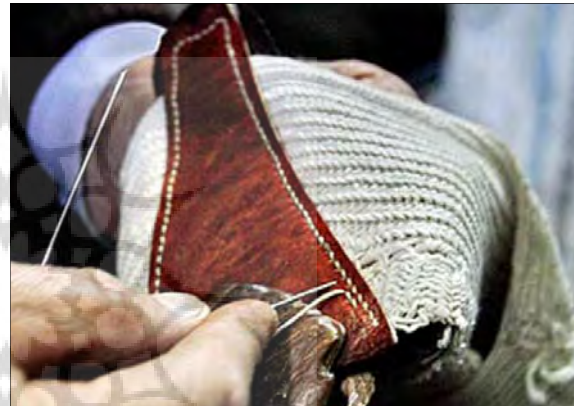
تصویر ۱۲- دوخت پاشنه به رویه،