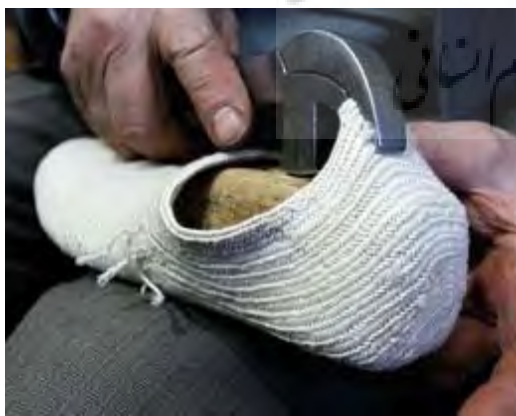
تصویر ۹- شکل دادن رویه در قالب با گاز انبر

بافت رویه در چهار سایز با اصطلاحات ۱ گرده پا (۳۸-۳۹) سیدی (۴۰-۴۱)، مُطارف (۴۲-۴۳)، بقال (۴۴-۴۵) انجام می‌شود. بعد از آماده‌سازی رویه، آن را در آب فروبرده و پس از آنکه آب اضافی آن گرفته شد، قالب (خل) می‌زنند (تصویر ۸) و با گازانبر رویه را روی قالب می‌کشند تا شکل قالب را به خود بگیرد (تصویر ۹). سپس نوار (تصویر ۱۰) را دورتادور جوراب با سریش می‌چسبانند. سپس قسمت پاشنه جوراب برش داده می‌شود تا چرم پاشنه که شامل قسمت زبانه و دیواره پاشنه است به آن دوخته شود (تصویر ۱۱ و ۱۲).