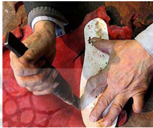
تصویر ۱۳- برش چرم،