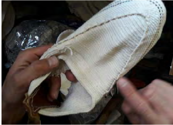
تصویر ۱۱- اتصال نوار به رویه و پاره کردن قسمت پاشنه،