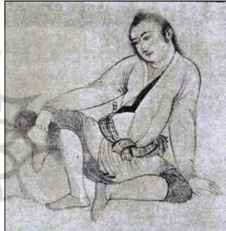
تصویر ۱: جوان با پای‌پوش گیوه، احتمالاً رضا عباسی، مکتب اصفهان، ۱۰۴۱ ه.ق.

واژه گیوه در مکاتبات خواجه رشیدالدین فضل‌الله به‌عنوان یکی از منسوجات معمول در کازرون و نیز در دیوان عبید زاکانی و نظام‌الدین قاری به کار گرفته شده است. نظام‌الدین قاری در دیوان البسه خود چنین می‌گوید: صد کفش و گیوه در طلبش بیش می‌درم چون آرزوی موزه بلغار می‌کنم (قاری یزدی، ۱۳۰۳: ۲۶) هم چنین به واژه گیوه در کتاب مزارات کرمان (اوایل قرن دهم هجری) پرداخته شده است: «شیخ گیوه‌ای در خانه می‌داشتند که چون در خانه بودند در پای می‌کردند» (کوهی کرمانی، ۱۳۸: ۱۳۲). در سیاحت‌نامه شاردن، سیاح معروف فرانسوی نیز به تفصیل در مورد کفش ایرانیان در دوره صفویه توضیح داده است. در این کتاب بیان شده که گیوه با تخت چرمی، پای‌افزار فراشان و تخت شیوه‌ای که دهاتیان می‌پوشیدند، با نام پاپوش گیوه شهرت داشته است. (شاردن، ۱۳۷۲: ۲۱۳-۲۱۴).