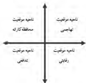
تصویر ۱. محور مختصات موقیعت راهبردی سازمان

با آسیب‌ها تلاش کند و به تدوین راهبردهای مناسب اقدام نماید.