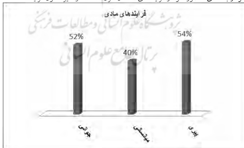
نمودار بسامدی حضور «تو» در فرایندهای گفتمان غزل عاشقانه و سیر تحول فرایندها

روحی ایام پیری و غلبه جهان بینی صوفیان‌ها از سویی دیگر نیز تحت تأثیر اوضاع نابسامانی که بر حکومت تیموریان در سالهای پایانی سلطنت سلطان حسین بایقرا حاکم بود برخلاف سنت غزل عاشقانه و اشعار عاشقانه دوران جوانی از دیدگاه «مکتب فرعی واسوخت» به مفهوم عشق زمینی نگریسته است. مهمترین نمود این نگرش در گفتمان غزل عاشقانه، تغییر رابطه میان «من» و «تو» از رابطه‌ای روحانی به رابطه‌ای طبیعی است؛ رابطه‌ای که برخلاف سنت غزل عاشقانه در آن اختیار و قدرت مطلق در دست عاشق است. از این رو جامی برخلاف منظومه دوران جوانی با قرار دادن «من» در صدر مشارکان گفتمان و حضور پربسامد او در فرایندهای مادی در قالب نقش کنشگر از وی چهره‌ای مختار و مقتدر عرضه کرده است؛ کنشهایی که طی آنها مدام «تو/ او» از سوی «من» نکوهش و تهدید می‌شود. از سوی دیگر «تو»، که در فرایندهای مادی غزل عاشقانه دوران جوانی همواره در نقشهای هدف و بهره‌ور ظاهر می‌شد، اکنون به مشارک اصلی نقش حاشیه‌ای «عناصر پیرامونی» مبدل شده است. کاهش حضور معشوق در فرایندهای ذهنی نیز به طور کامل بیانگر این مدعاست. تغییر ماهیت و جایگاه «تو» در منظومه‌های سه‌گانه جامی در قالب ساختار تعدی در نمودارهای ذیل ترسیم شده است: