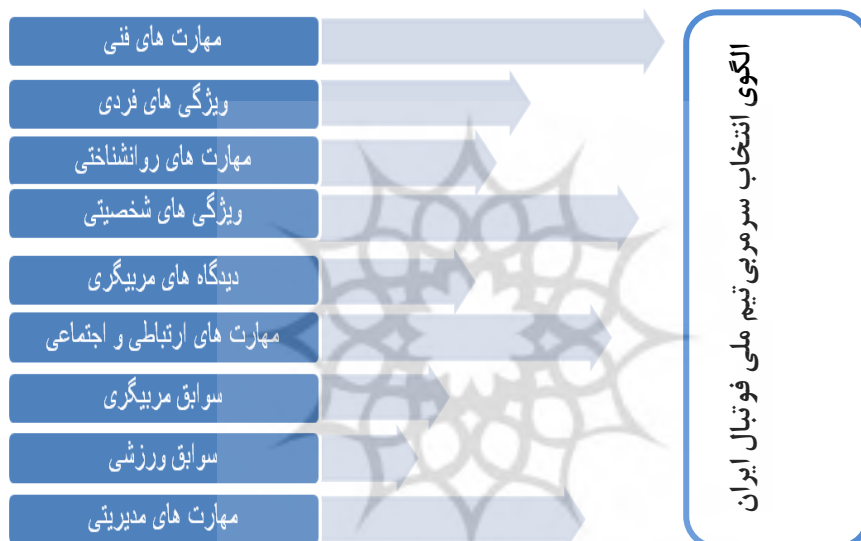
شکل ۱- الگوی نظری انتخاب سرمربی تیم ملی فوتبال

در پایان و با توجه به یافته‌های پژوهش، الگویی نظری برای انتخاب سرمربی تیم ملی فوتبال از دیدگاه جامعه پژوهش طراحی گردیده و در شکل ۱ نشان داده شده است. در این الگو فاصله شاخص‌ها تا الگوی انتخاب، بیانگر میزان اهمیت آن شاخص می‌باشد. چنانچه هر شاخص تا الگوی انتخاب فاصله کمتری داشته باشد، بیانگر میزان اهمیت آن شاخص در انتخاب نسبت به دیگر شاخص‌های انتخاب است.