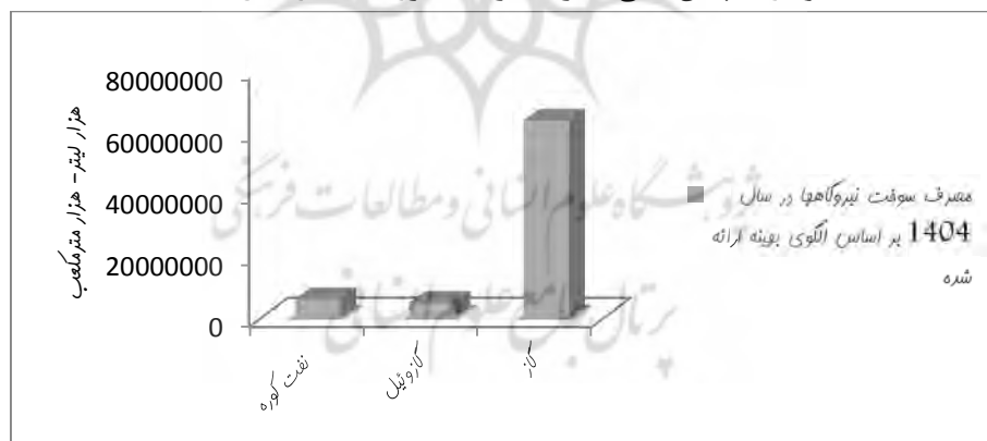
نمودار ۲. پیش بینی مصرف سوخت نیروگاه‌ها در سال ۱۴۰۴