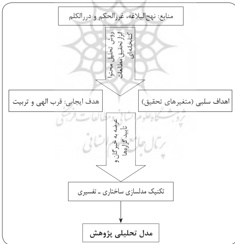
نمودار ۱: نقشه راه محقق در تحقیق حاضر

و) تجزیه و تحلیل MICMAC - هدف از این تجزیه و تحلیل، تشخیص و تحلیل قدرت هدایت و وابستگی متغیرهاست.