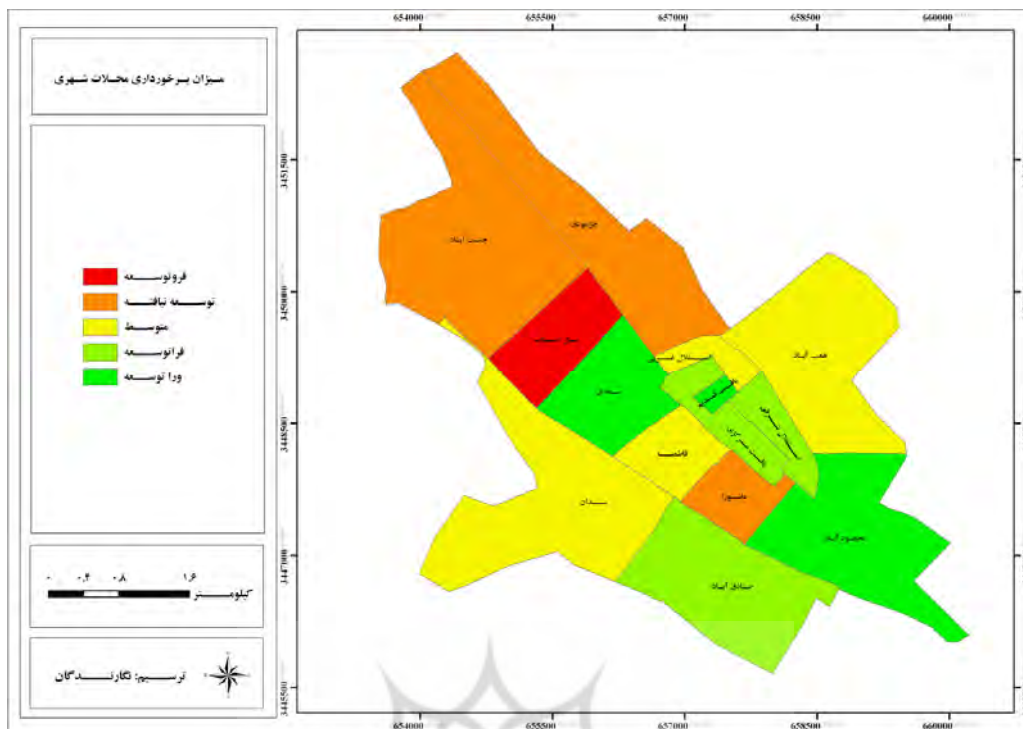
شکل ۲- نقشه سطح بندی محلات شهری بر اساس میزان برخورداری از امکانات و خدمات