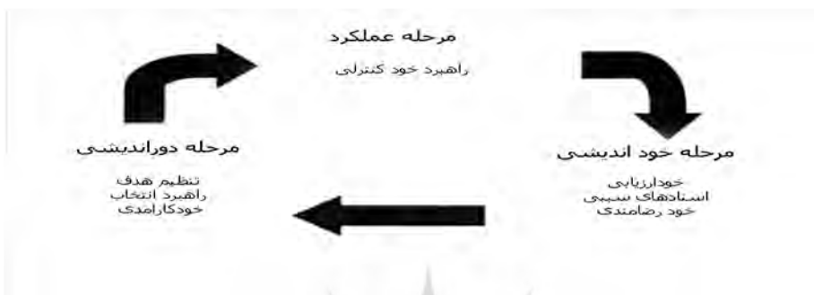
شکل ۲. مراحل مدل خودتنظیمی، خودتنظیمی از طریق خودارزیابی، خودکارآمدی، و تنظیم هدف باعث عملکرد بهتر ورزشکاران می‌گردد (کلری و زیمرمن، ۲۰۰۱)

تمام مؤلفه‌های هوش هیجانی (خودآگاهی، خودآگاهی اجتماعی، مدیریت خود، مهارت‌های اجتماعی، و خودانگیزی) با موفقیت ورزشی نیز، ارتباط مثبت و معناداری وجود دارد و در رتبه‌بندی مؤلفه‌های هوش هیجانی، مؤلفه خودآگاهی در اولویت اول قرار دارد.