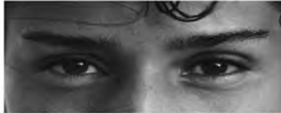
کل عصبانی آسوده خاطر بانشاط

متعدد مورد استفاده قرار گرفته است (۲۳، ۲۱، ۱).