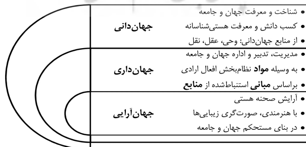
شکل ۲: مدل پیوستگی و سلسله‌مراتب جهان‌دانی، جهان‌داری و جهان‌آرایی

حق‌محوری در تدبیر نظام اجتماعی با سه عنصر مهم جهان‌دانی، جهان‌داری و جهان‌آرایی سامان می‌پذیرد، به طوری که هر لاحق، موهون سابق و هر سابق، پایه لاحق خواهد بود (جوادی آملی، ۱۳۹۱، ص ۴۱). از نظر ایشان، به‌کارگیری هنر (جهان‌آرایی) مسبوق به اتقان بنا و استحکام ساختارهای اساسی جامعه است و این مهم را فن شریف جهان‌داری اداره می‌کند و تدبیر و مدیریت هر ساحتی، فرع معرفت هستی‌شناسانه آن عرصه است که فن عریق جهان‌دانی کفیل آن است. در شکل شماره ۲ مدلی ترسیم شده که پیوستگی و سلسله‌مراتبی بودن این سه عرصه مهم را نشان می‌دهد.