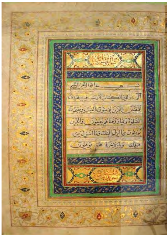
تصویر ۵. قرآن، به خط ضیاء السلطنه، مأخذ: آستانه مقدسه حضرت معصومه، قم.

رشید السلطنه به چشم می خورد. صفحه اول و دوم قرآن تماماً مذهب به سبک هرات است و طرح کتیبه ای داشته و دارای دو سرلوح ممتاز و مذهب چهار کتیبه بازوبندی مذهب ممتاز دارد. دو لوح پیشانی و دو لوح در متن لاجوردی آن ها اسم سوره فاتحه الكتاب و سوره بقره را با خط نسخ بسیار شیوایی با زر نوشته اند. بین سطور طلااندازی دندان موشی زوج تحریر مشکی است. مابقی اوراق صحیفه شریف مجدول کمندکشی زرین و الوان است. ختم آیه ها با گل های پنج پر طلایی مشخص است، جزء، نصف جزء، حزب و سرسوره ها در حواشی ترنج ها مذهب تزئینی، در متن لاجوردی به خط نسخ با زر نوشته شده در کتیبه های بازوبندی تزئینی که اطراف طلااندازی دندان موشی زوج تحریر مشکی است، در متن لاجوردی به خط نسخ با زر نگاشته شده در صفحه آخر کلام الله مجید در ترنج مذهب متن لاجوردی اسم فتح علی شاه قاجار را با زر به خط نسخ نوشته اند و در حاشیه همین صفحه به خط تعلیق و مرکب مشکی نوشته شده: