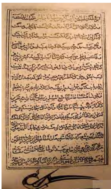
تصویر ۸. قرآن، به خط خورشیدکلاه، مأخذ: همان.