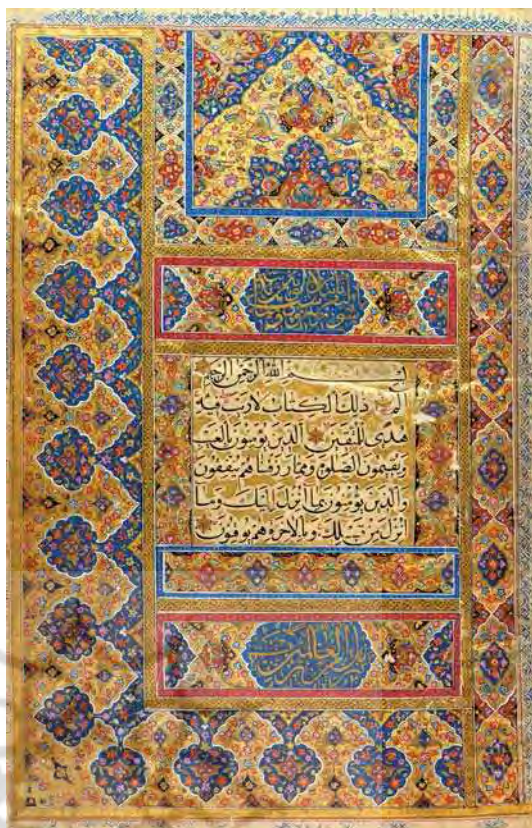
تصویر ۳. قرآن، به خط ام السلمله، مأخذ: کتابخانه کاخ گلستان، تهران.

گوهرشاد، دختر میرعماد، خود خوشنویسی شهره بود. چنان که شاهان به عنوان استادان این هنر معروف و تجلیل شده اند شاه دختران نیز از این لحاظ واپس نمانده اند، برای نمونه: سلطان بانوی صفوی دختر شاه اسماعیل اول صفوی و زیب النساء (بیگم) دختر خوش قریحه اورنگ زیب، که نه تنها به مشق سه شیوه خوشنویسی پرداخت، بلکه خود از حامیان شاعران، دانشمندان و خوشنویسان بود؛ همچنین، ملکه جهان که قرآن دست نوشت او با حروفی بی اندازه برجسته و رنگارنگ در کتابخانه چستریبیتی موجود است به احتمال زیاد همان همسر فاضل سلطان ابراهیم دوم عمادشاه فرمانروای بیجاپور (۱۵۸۰ق-۱۶۲۶م) بود، اگرچه