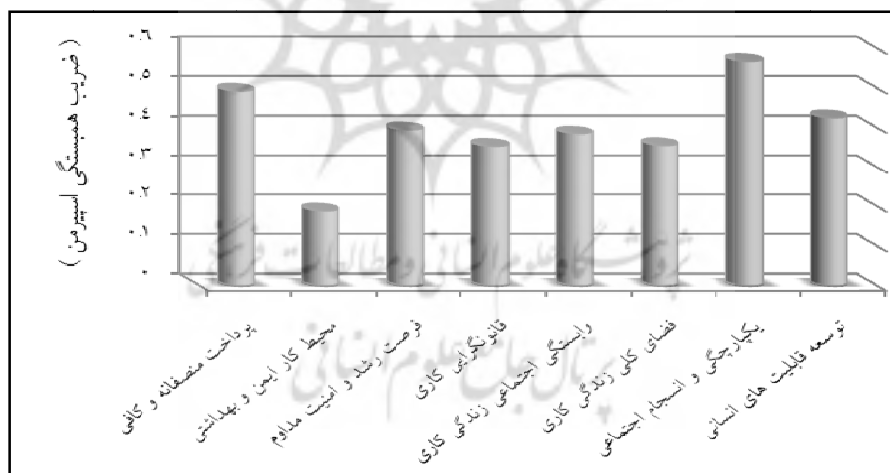
شکل ۲: مقایسه ضریب همبستگی بین مؤلفه های کیفیت زندگی کاری و رضایت شغلی