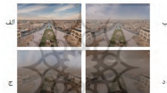
شکل ۱. چهار وضعیت متفاوت کیفیت هوای شهر یزد

سپس به بررسی روابط بین تمایل به پرداخت و ویژگیهای شخصی، اجتماعی و اقتصادی افراد به کمک مدل رگرسیونی به صورت زیر پرداخته شده است: