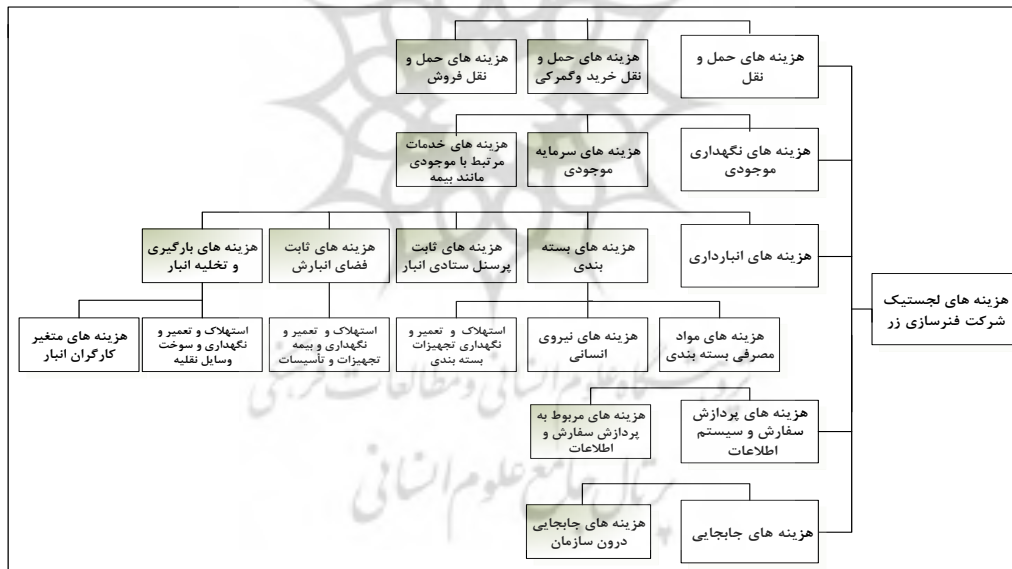
نمودار شماره (۳): مدل هزینه‌های لجستیک شرکت فنرسازی زر

شرکت فنرسازی زر، عضو گروه فنرسازی زر و گروه خودرو سازی سایپا در زمینه تولید محصولات می‌باشد که در سیستم تعلیق خودرو کاربرد دارند همچون انواع فنر لول، موجگیر و غیره مشغول به فعالیت است. در شرکت فنرسازی زر تأمین مواد اولیه داخلی از فولاد آلیاژی ایران در یزد و تأمین مواد اولیه فنر لول از خارج انجام می‌گیرد. مواد تأمین داخل به دو دسته مواد مستقیم و با واسطه تقسیم می‌شوند. یک سری از مواد مستقیم به کارخانه ارسال می‌شوند و یک سری دیگر موادی هستند که با واسطه تبدیل کار جهت تغییر قطر به کارخانه ارسال می‌شوند. مشتریان محصولات شرکت فنر سازی زر سایپا (تهران و کاشان و پارس خودرو و سایپا یدک)، ایران خودرو، زامیاد و توزیع به بازار تهران می‌باشند. در مورد محصولات می‌توان گفت که نیاز به واسطه تکمیل کار برای مونتاژ دارند محصولات به تکمیل کار ارسال می‌شود. با توجه به مدل هزینه‌ای ارائه شده در نمودار شماره (۱)، انجام مصاحبه‌های هدایت شده حضوری با مدیران واحدهای مربوطه و مستندات مالی شرکت، هزینه‌های لجستیک با تحلیل محتوای داده‌ها مقوله بندی و مدل مفهومی مورد نظر در نمودار شماره (۳) ارائه شده است.