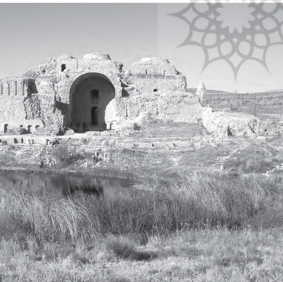
آشکده فیروز آباد