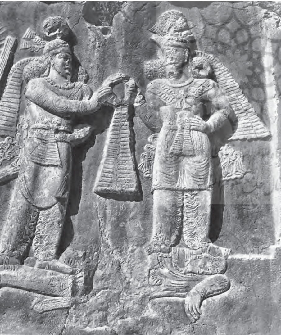
میترا قدرت شاه ساسانی را بشمار وعبیت می‌بخشد

آیین دیگری که در شمال شرق ایران نفوذ کرده بود و تهدیدی برای وحدت مذهبی جامعه به‌شمار می‌رفت دین بودایی بود. بوداییان از یک طرف با هند و از طرف دیگر با چین در ارتباط بودند. «مراکز بودایی ایران زیارتگاه مهم بوداییان هند و چین شده بود و نه تنها در سرزمین بلخ و بامیان، در مغرب افغانستان امروزی و ناحیه طخارستان و چغانیان - یعنی دو ناحیه بسیار حاصلخیز آسیای مرکزی - عده ایشان بسیار فراوان شده بود، بلکه در مراکز مهم آسیای مرکزی مانند سمرقند و بخارا و شهرهای دیگر نیز شمار ایشان