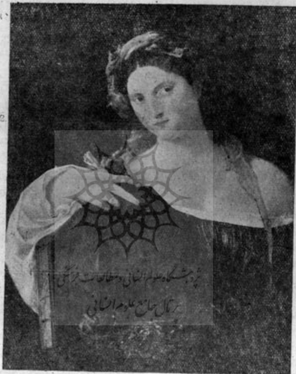
جمال فانی - کار تیسین

می کند، اما در چهره نجیبانه و باوقار زن و در لبخند نهانی که بر لبان او هست رازی نهفته است که هر بیننده را مجنون می کند. تیسین در سال ۱۵۴۷ و ۱۵۵۰ دو بار دیگر بدربار امپراطور در شهر