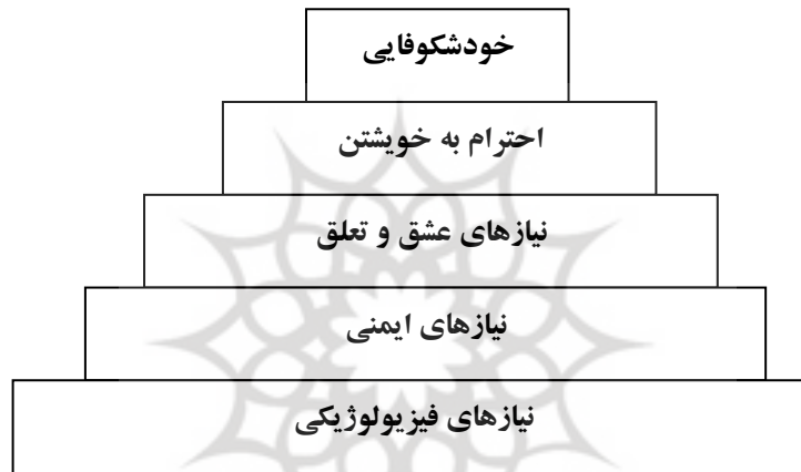
شکل سلسله مراتب نیازها (اقتباس از ساعتچی، ۱۳۸۸)

الف) نظریه سلسله مراتب نیاز مازلو: مازلو معتقد است که آدمی به طور مداوم و پیوسته در حال برانگیختگی است و فقط برای مدت کوتاهی می تواند به ارضای کامل نیازها برسد وقتی یک نیاز ارضا شد، نیاز دیگری جای آن را می گیرد و می توان نیازها را به صورت سلسله مراتب و به ترتیب تقدم و تأخر و مانند یک هرم نشان داد (ساعتچی، ۱۳۸۸).