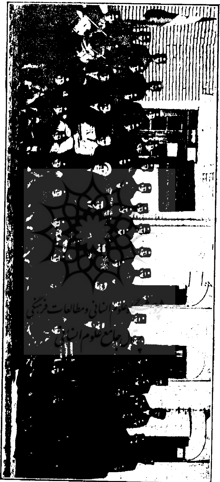
Khayyam School in Ahwaz