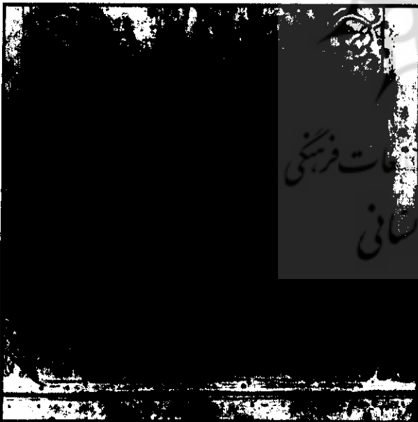
در مسجد امام اصفهان با امضای واهب