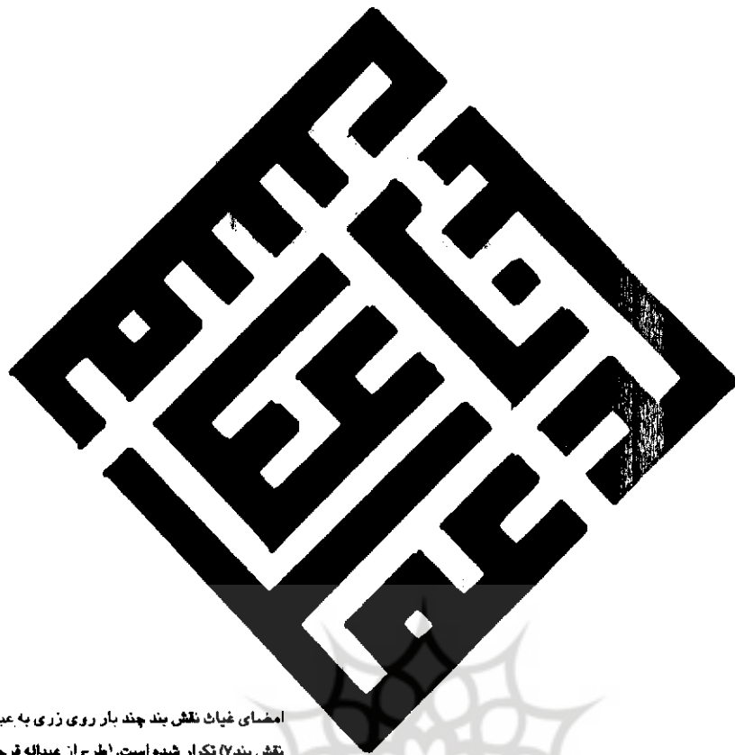
امضای غیاث نقش بند چند بار روی زری به عبارت (عمل غیاث نقش بند ۷) تکرار شده است. (طرح از عبدالله قرچانی)