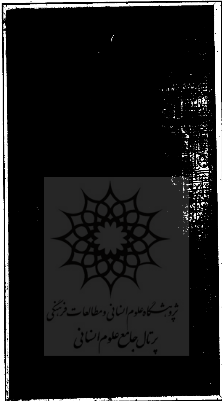
زری موزه ملی ایران دست بافت غیاث نقش بند (برگرفت از کلچینی از هنر دوران اسلامی)