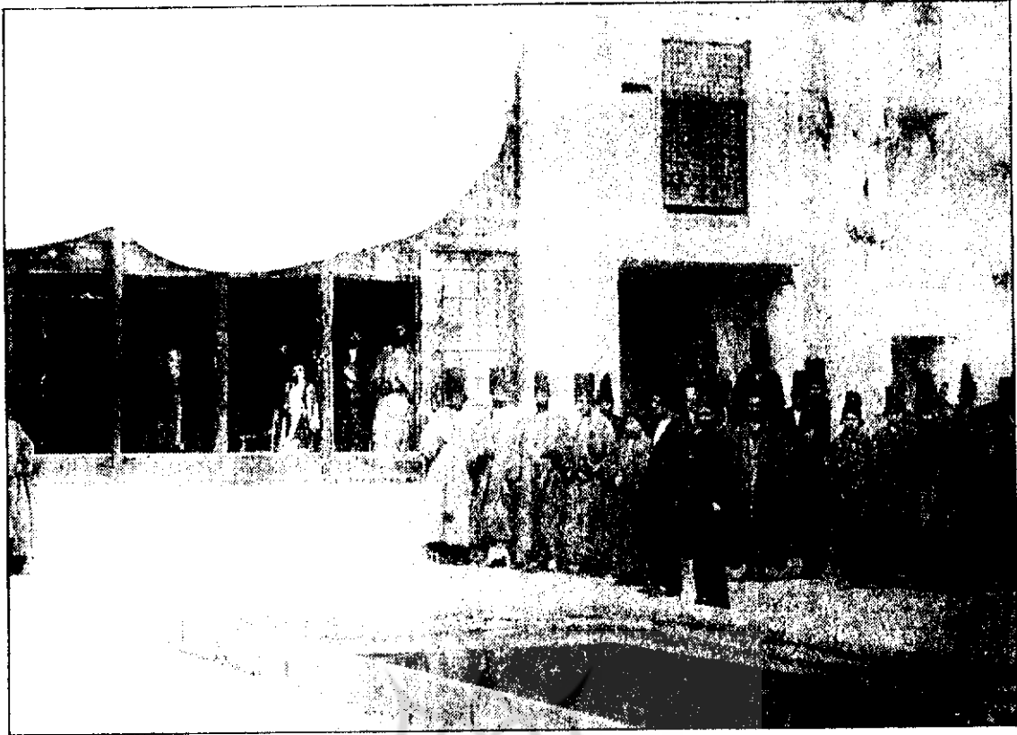
● عکس اصلی شماره ۲