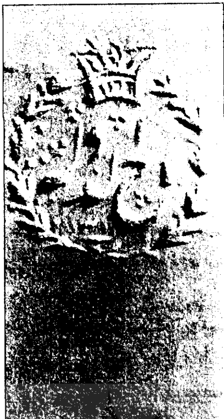
● مهر برجسته سرکاغذ تاج الدوله

اشاره کرده است. از آنجا که در ثبت تصویر به روش داگروتایپ (Daguerrotype) از صفحات نقره و یا صفحات مسی نقره اندود استفاده می‌شده در متون فارسی مربوط به عکاسی در عهد قاجار از کلمه «صفحه نقره» نیز به عنوان معادل فارسی داگروتایپ استفاده شده است و در همین رابطه خالی از لطف نیست اگر بدانیم که در قدیمی‌ترین سند خطی فارسی که در سال ۱۲۵۹ هجری قمری / ۱۸۴۳ میلادی مقارن با سالهای اولیه اختراع داگروتایپ نوشته شده و تاکنون به نظر محققان این رشته نرسیده است ضمن بیان مطلبی در مورد انواع اختراعات جدید از عکاسی و داگروتایپ به عنوان «عمل کشف که نوعی از نقاشی است» نام برده شده است. وجه اطلاق کشف (بازیافت) بر عکاسی شاید ناشی از امکان بازیافت زمان سپری شده و لحظات فناپذیر بوسیله عکس باشد.