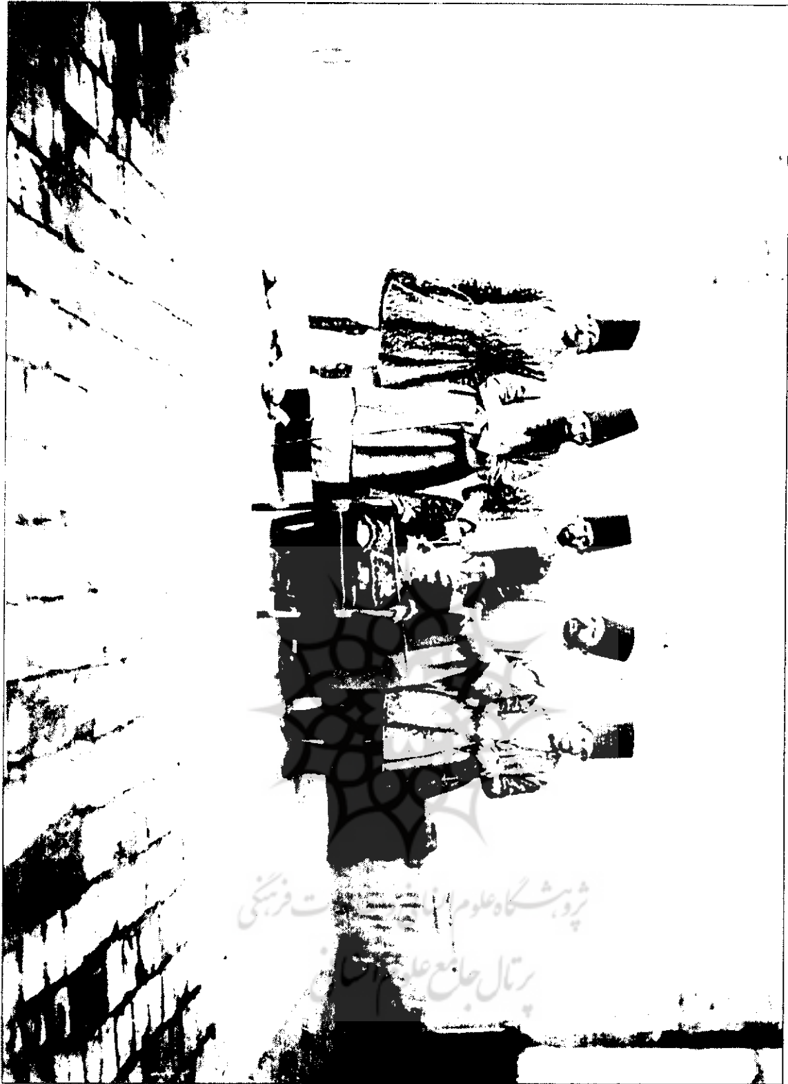
● مظفرالدین میرزا در هشت سالگی