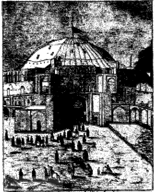
شrine of Imam Hussein (ع) in Karbala, Iraq

جای تعجب است که اعلان‌های دستنویس ویژه شبیه‌خوانی بیادگار مانده از آن زمان، گوی سبق‌ت از پوست‌های رنگی نمایش‌های امروز می‌رُبايد.