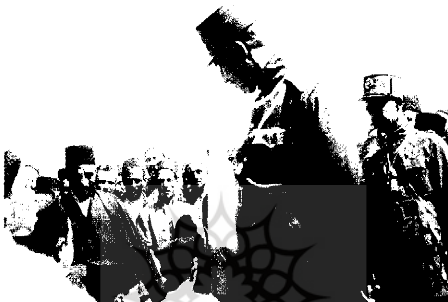
رضاشاه در حال گفت‌وگو با مردم | ۲۱۱۲-۱۳۲۲ ط

شناخته می‌شد. شاه کوشید تا حصول غله و توزیع شهری را از طریق هفت مجموعه انبار غله و آسیاب در شهرهای بزرگ ایران متمرکز سازد؛ اما قبل از جنگ فقط انبار غله تهران با گنجایش ۶۰،۰۰۰ تن با ذخیره‌ای شش ماهه برای تهران پیش از جنگ، تکمیل شد. زمینداران مکلف بودند سهم خود را از هر برداشت محصول، به بهای معینی پایین‌تر از قیمت‌های سایر کشورهای خاورمیانه به دولت بفروشند. این اصلاح، منجر به ساماندهی ذخیره نان پایتخت شد و تا حدی آرامش شهری را تأمین کرد؛ اما این امر همچنین مسلم ساخت که دولت مسئول هرگونه کمبود شناخته خواهد شد. بنابراین، شورشهای مربوط به نان دارای ماهیتی علناً سیاسی بود.