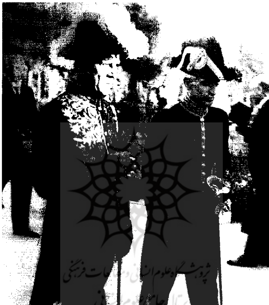
سر ریدر ویلیام بولارد سفیر انگلیس در ایران | ۱۲۶۸-۴ع

یک دلار در اردیبهشت ۱۳۲۱ افزایش یافت. این قیمت‌های روبه افزایش، زمینداران را تشویق کرد که ذخایر گندم خود را پنهان نگه دارند و این امر مشکلات دستیابی به گندم را بیشتر کرد. دو هفته پس از استعفای رضاشاه قیمت بازار برای گندم در مقایسه با قیمت خرید از سوی دولت با نرخ هر تن ۲۰/۱۵ دلار، به هر تن ۳۷ دلار افزایش یافته بود. در مهر ۱۳۲۰ دولت در کوشش برای کسب موافقت زمینداران با مقررات دولتی مبنی بر