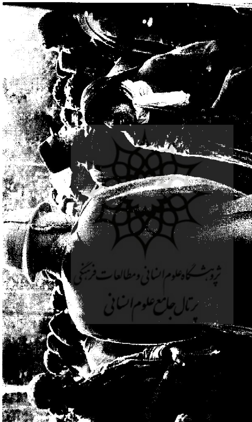
گوشدای از تظاهرات مردم در روز ۱۷ آذر ۱۳۲۱ (پهلوی نان) | ۵۱۹-۴۰۰