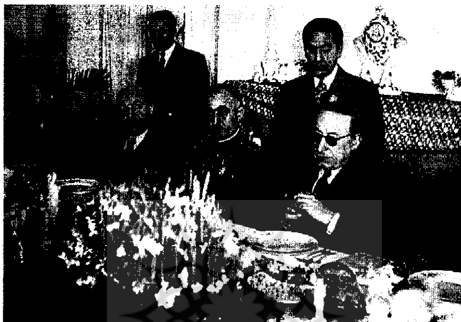
احمد قوام نخست‌وزیر و چند تن از اعضای کابینه وی ( ۲۳۳۷-۱۱ع )

با وجود این، فعالیت سیاسی نخبگان در تمام طول شب ادامه یافت. حزب پیکار (جوانان)، چند سردبیر روزنامه‌ها، عده‌ای از نمایندگان مجلس، یکی از نخست‌وزیران پیشین و یکی از رؤسای سابق اداره خوراک کوشیدند قوام را وادار به استعفا به نفع علی سهیلی کنند. ۳۳ شاه و اطرافیان نظامی او از جمله [یزدان] پناه رئیس ستاد ارتش و رادسر رئیس پلیس تهران چندبار به قوام توصیه کردند که استعفا کند به این امید که به جای او دولتی نظامی روی کار بیاورند. قوام با اتکا به اعلام حمایت انگلیس، شوروی و آمریکا، از استعفا خودداری کرد. به جای آن، دستور داد برای بازگرداندن نظم اقدامات فوری به عمل آید. این اقدامات عبارت بودند از: ممنوعیت عبور و مرور در شب از ساعت ۸ بعدازظهر، توقیف کامل تمام روزنامه‌ها، سانسور رادیو تهران، انتشار یک روزنامه رسمی دولتی (اخبار روز) و گماردن سپهبد احمدی برای برقراری دوباره نظم