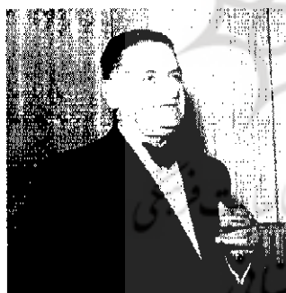
علی سهیلی نخست‌وزیر [۱۳۲۱-۱۳۲۷ ع]

در اواسط سال ۱۳۲۱ دولت علی سهیلی (اسفند ۱۳۲۰ - مرداد ۱۳۲۱) ناتوانی خود را در حل مشکلات فراوان ایران ثابت کرده بود. در بیست و دوم مرداد ۱۳۲۱ مجلس دولت جدیدی را به صدارت