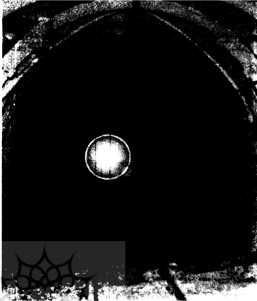
(جدول شماره ۸)

این گروه از معادن در مقایسه با دو گروه دیگر از تنوع بیشتری برخوردار است