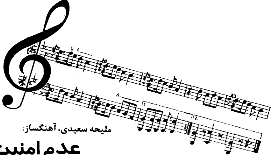
ملیحه سعیدی، آهنگساز: