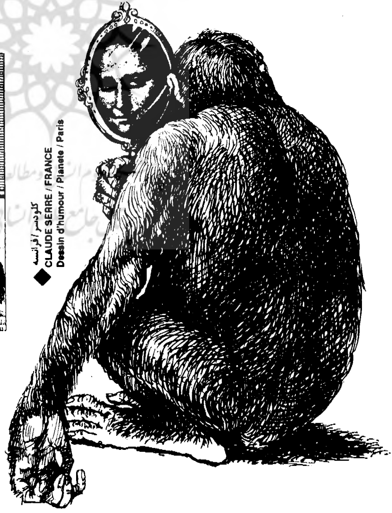
کلود سرر / فرانسه CLAUDE SERRE / FRANCE Dessin d'humour / Planete / Paris