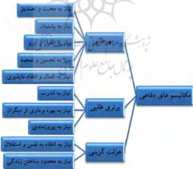
تصویر شماره ۴: نیازهای معطوف به هر مکانیسم

و نیازهای مکانیسم مردم‌گزیزی (عزت‌گزینی) عبارتند از: الف) نیاز به محدود ساختن زندگی؛ ب) نیاز به اتکاء به نفس و استقلال. (ر.ک. برزگر ۱۳۸۹: ۳۹)