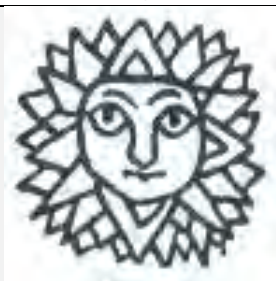
نقش پارچه ابریشم، قرن ۶ ه. ق. (خزائی، ۱۳۸۱)