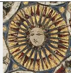
قسمتی از کاسه، اواخر قرن ۱۲ م. (موزه متروپولیتن)