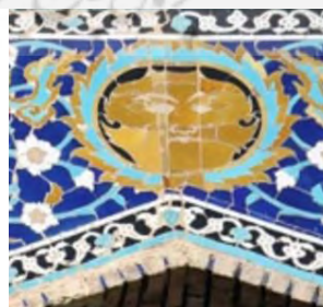
سردر بازار فیصریه، اصفهان (محمدی میلاسی، ۱۳۹۸)