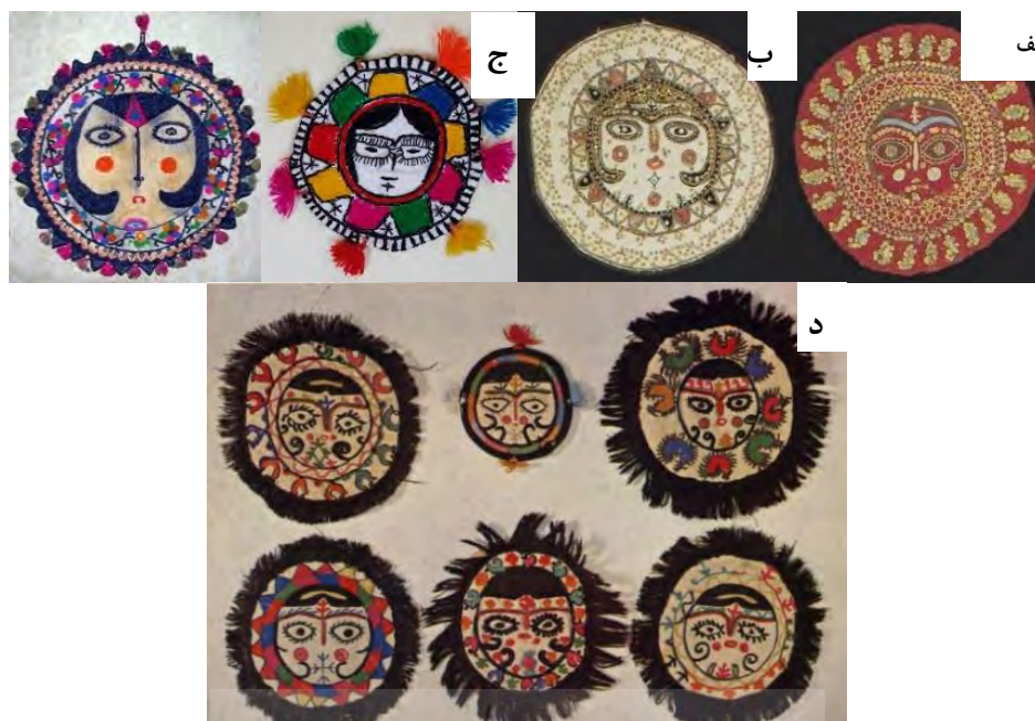
تصویر ۶. آویزهای خورشیدخانم، الف: اصفهان، منطقه دماب، معاصر (عکس: معصومه میرزایی، ۱۳۹۸)؛ ب: اصفهان، شهر ورزنه، معاصر (اهدایی استاد فتحعلی قشقای)؛ ج: اصفهان، تاریخ تولید نامعلوم (Gillow, 2010, 163)؛ د: طلسم‌های بختیاری، معاصر (گلاک و گلاک، ۱۳۵۵، ۲۳۷).

به خود گرفتند و خورشید به یک نماد بصری خداگونه تبدیل شد (Fingesten, 1959, 19). در تفکرات هندی چشم انسان به خورشید تشبیه شده و چشم آسمان همان خورشید و بره‌ماست و خورشید در چشم انسان سکنی دارد. در اساطیر یونان نیز زئوس چشم همه‌سونگر است که همه جهات دنیا را می‌بیند و مطابق با گفته اویدئوس برابر خورشید است (ibid, 20). در متون مصری نیز چشم هورس اشاره به خورشید دارد و به‌عنوان یک نماد جهت محافظت در برابر اهریمن است (بروس میتفورد، ۱۳۹۴، ۱۹۵). در واقع از چشم هم به عنوان خدای خورشید، هم به عنوان طلسم و محافظت از تأثیرات منفی استفاده می‌شده است (Ulmer, 2003, 5). در اساطیر ایران میترا معرف گرما و حیات، حاکم آسمان و تماشاگر همه چیز در جهان است و سربازان رومی وی را به عنوان خورشید شکست‌ناپذیر می‌پرستیدند. در ارتباط با اهمیت جایگاه خورشید در بین ایرانیان در تقویم کهن ایرانی، روز یازدهم هر ماه خیر یا خورروز و به نام خورشید مرسوم است. یک جا کالبد اهورامزدا همانند خورشید تصور شده و جای دیگر، خورشید چشم اهورامزدا دانسته شده است. تطهیر و ازاله پلیدی‌ها یکی از عمده‌ترین وظایف خورشید به حساب می‌آید. در فقه اسلامی هم خورشید درزمره مطهرات یاد شده است (یاحقی، ۱۳۸۶، ۳۳۸). در اینجا می‌توان ارتباط چشم و خورشید را در تمدن مصر، یونان و ایران یافت همچنین رابطه خورشید با