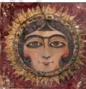
قسمتی از یک نقاشی پشت آینه، قاجار (موزه مقدم)