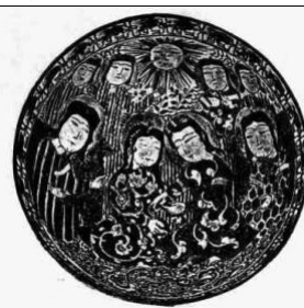
کاسه لعابدار، قرن ۶ ه. ق. (بختورتاش، ۱۳۸۴)