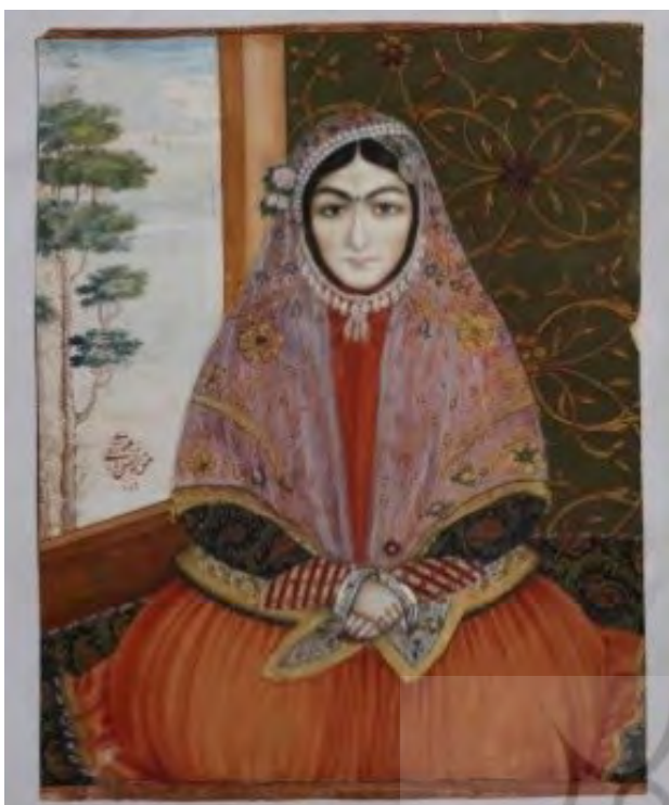
تصویر ۵. نگاره خورشیدخانم، صنیع‌الملک، اجزاء صورت شبیه نقش‌مایه خورشیدخانم‌های دوره قاجار.

دسترس نیست ولی با توجه به نمونه‌های مشابه از اصفهان و مناطق مرکز و شرق آن اعم از ورزانه، دماپ و زردنجان (تصویر ۶) و همچنین نمونه‌های مشابه ذکر شده از ایل بختیاری در کتاب «سیری در صنایع دستی ایران» (تصویر ۶، ۵) می‌توان چنین استنباط کرد که نمونه‌های موجود در مخزن کاخ صاحبقرانیه (تصویر ۲) نیز دارای کاربردی مشابه با مناطق یادشده باشد. گلاک در کتاب مذکور در توضیح کاربرد این آویزها ذکر می‌کند: «صورت خورشیدخانم را اغلب بر روی طلسم‌های مدور یا چهارگوش می‌کشند و این طلسم‌ها را روی دیوار خانه‌ها، در عروسی‌ها یا اتاق بچه‌ها برای آرایش یا دفع چشم بد می‌آویزند» (گلاک و گلاک، ۱۳۵۵، ۲۳۵)؛ اطلاعات میدانی جمع‌آوری شده از مناطق ورزانه، دماپ و زردنجان نیز، این کاربرد را برای این نقش‌مایه در این مناطق، تأیید می‌کند.