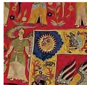
قسمتی از رودوزی، قرن ۱۰ ه. ق. (پوپ و اکرم، ۱۳۸۷)