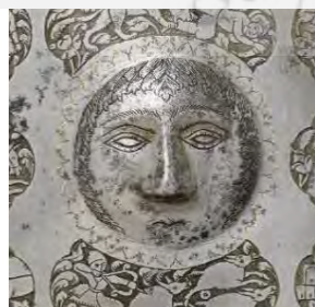
قسمتی از یک زره چهار آینه، نیمه اول قرن ۱۹ م. (موزه متروپولیتن)