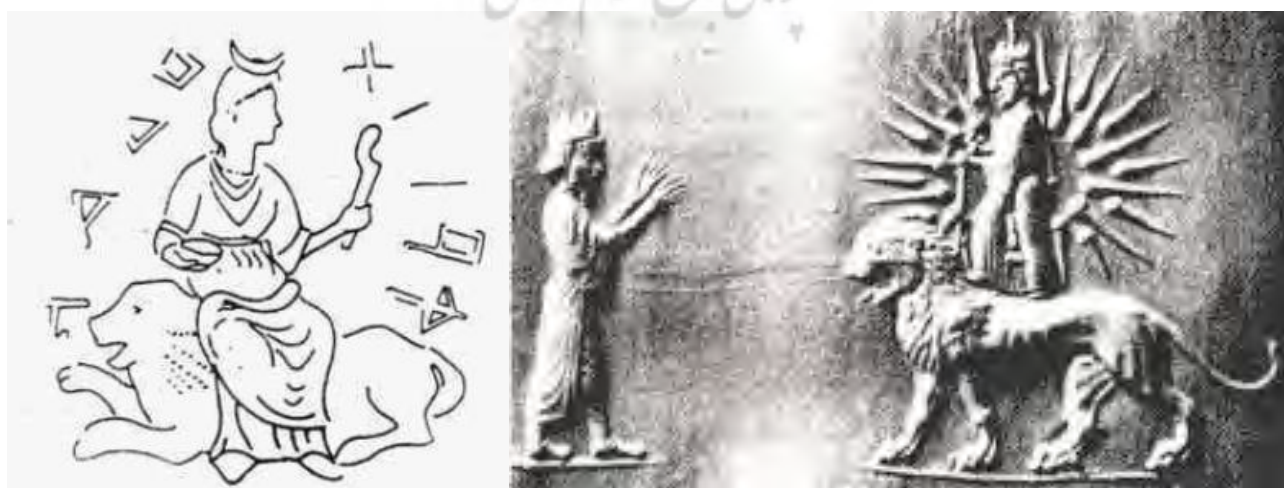
تصویر ۴. آناهیتا ایستاده روی شیر. مأخذ: بختورتاش، ۱۳۸۴، ۴۰۵-۴۰۲؛ آناهیتا سوار بر شیر. مأخذ: بختورتاش، ۱۳۸۰، ۳۴۲.