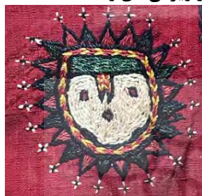
قسمتی از زرتشتی دوزی یک پیراهن، احتمالاً قاجار (موزه مقدم)