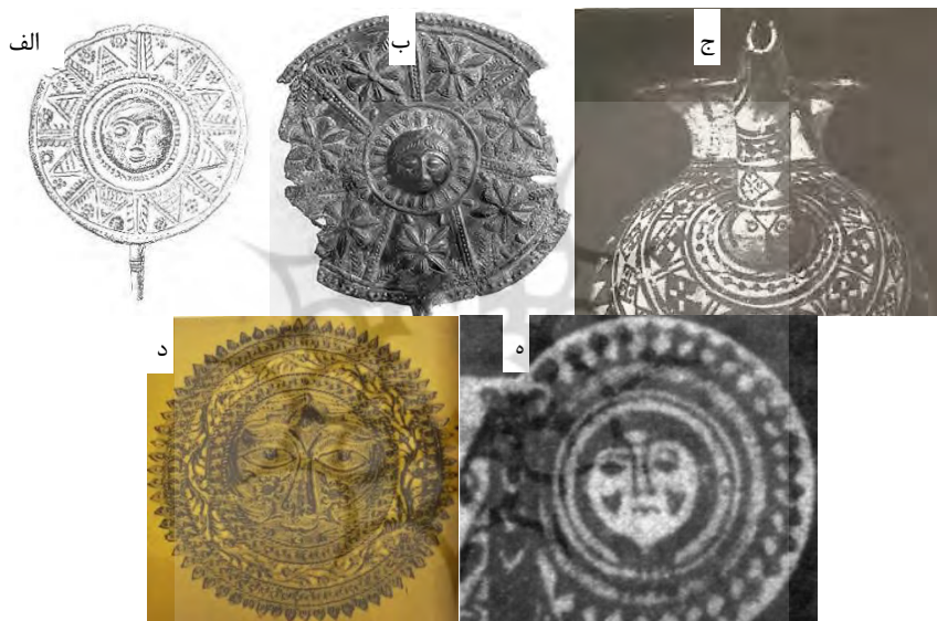
تصویر ۳. الف: سفال با نقش صورت زن، قرن ۱۰ تا ۹ ق. م.؛ ب: سرسنجاق مفرغی، لرستان، هزاره اول ق. م.؛ ج: سرسنجاق مفرغی، لرستان، هزاره اول ق. م.؛ د: جزئی از یک اثر، نقش صورت زن درون چند دایره، هخامنشی؛ ه: لوح مشبک طلا، نقش صورت زن درون دایره، مکشوفه از غرب ایران، قطر ۱۱/۸ سانتی‌متر، اشکانی.

بعد از اسلام نیز هنرمندان از نقش‌مایه خورشید با صورت انسان