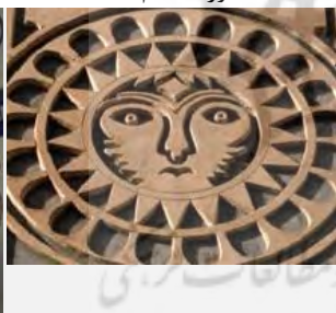
گچبری، خانه بروجردی‌ها، قاجار