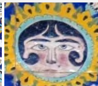
سردر کاخ عالی قاپو، اصفهان (محمدی میلاسی، ۱۳۹۸)