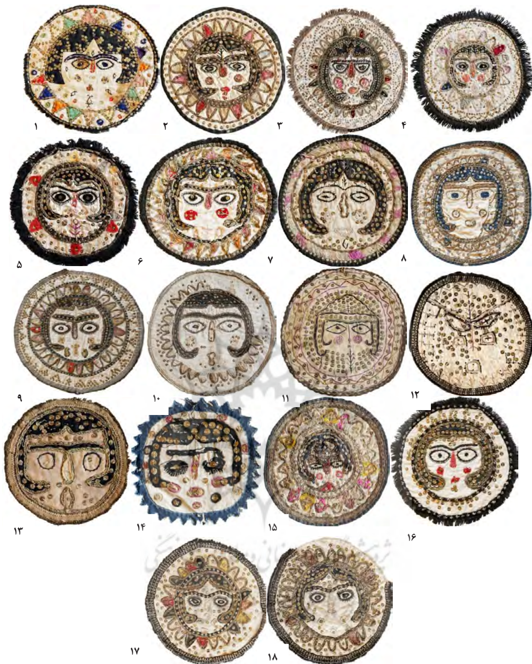
تصویر ۲. دیوارکوب‌های خورشیدخانم.

متأخر، متحول‌شده لفظ میتراست. در اوستا و کتیبه‌های هخامنشی میترا و در سانسکریت میترا آمده است. این لفظ در پهلوی تبدیل به میترا شده است و ما امروز آن را مهر می‌گوییم، به معنی خورشید، محبت، پیمان» (دادور و منصور، ۱۳۸۵، ۱۳۹). مهر در «وید» برهمنان مانند اوستا پروردگار روشنایی و فروغ است اما در ایران زرتشتی به پیروی از اندیشه یکتاپرستی، مقام مهر کاهش پذیرفت و در میان خدایان فقط اهورامزدا اهمیت یافت و مهر تنها به عنوان فرشته‌ای بلندپایه باقی ماند (باحقی،