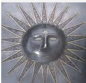
قسمتی از یک زره، اصفهان، حدود قرن ۱۱ یا ۱۳ ه. ق. (شاهکارهای هنر ایران در مجموعه‌های لهستان، ۱۳۹۲)