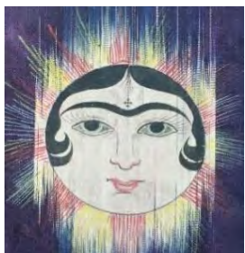
نقاشی روی قسمتی از پارچه دارائی، قرن ۱۹ م. (موزه ویکتوریا و آلبرت)