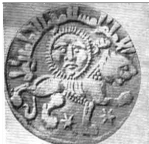
سکه، قرن ۷ ه. ق. (جمال زاده، ۱۳۴۴)