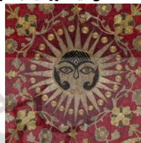
قسمتی از رودوزی، قرن ۱۹ م. (موزه ویکتوریا و آلبرت)