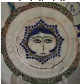
بشقاب سفالی، میبد، معاصر