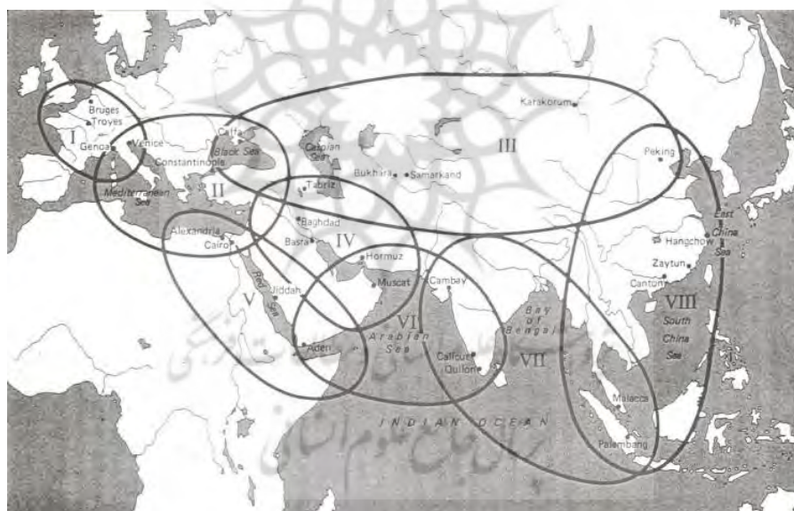
شکل ۱. نظام جهانی ارتباطات چند حلقه‌ای غیرمتمرکز تا پایان قرن سیزدهم میلادی