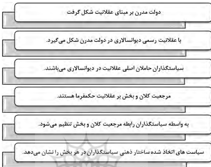
شکل ۲. چارچوب (مدل) مفهومی مقاله