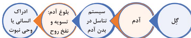
شکل ۳: خوانش اعجازین سیاق سجده

خوانش پیدایش نوع تکاملی هم در سیاق سجده با یک شرط ممکن است، این که تداوم نسل انسان در آیه، از نطفه بشر اولیه و پیشامدرن یا اولین جاندار دارای نطفه در نظر گرفته شود. (شکل ۴)