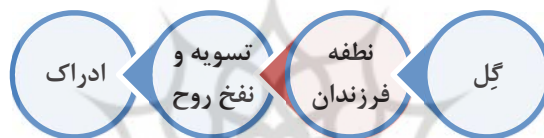
شکل ۲: ترتیب مراحل خلقت در سیاق سجده

بنابراین خوانش پیدایش نوع به صورت اعجازین قوت می‌یابد؛ زیرا در این خوانش پس از پیدایش آدم و همسرش از مجسمه گلین، نسل انسان از نطفه این دو تداوم یافته است. در ادامه آیه از مرحله تسویه و نفخ روح یاد می‌شود. اینجا این مسئله مطرح می‌شود که آیا نفخ روح در آدم پس از تکثیر نسل او بوده است؟ طبق خوانش پیدایش اعجازین، با نفخ روح آدم جان یافت (طوسی، بی تا: ۸ / ۲۹۷) و پیش از آن جسمی خاکی و بی جان بود، از این رو این خوانش نیز با ترتیب سیاق سجده (شکل ۲) تفاوت دارد. (شکل ۳)