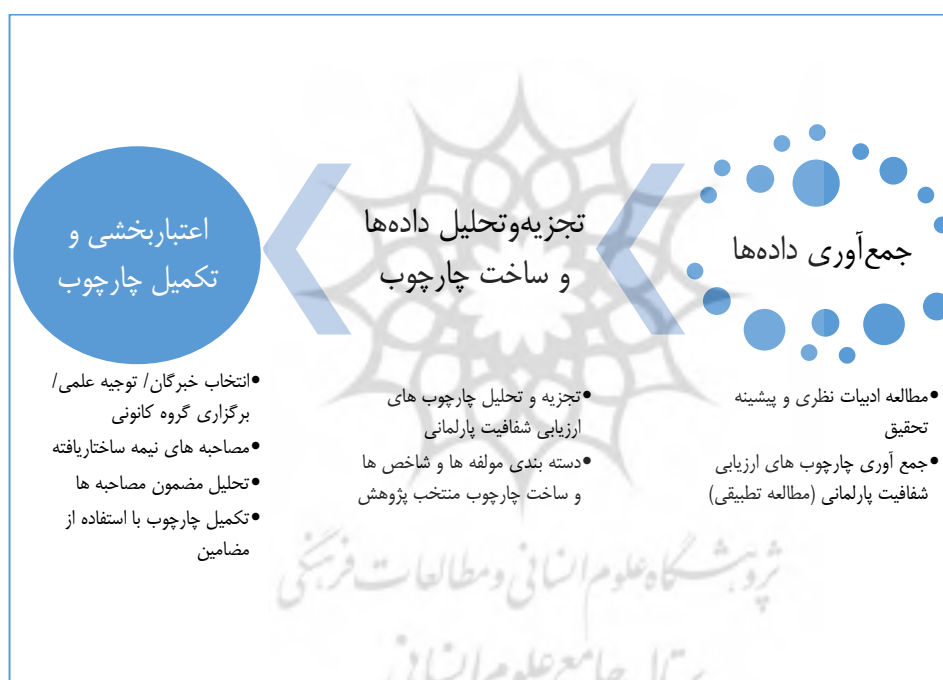
شکل ۲. فرایند کلی روش پژوهش

در پژوهش حاضر پس از مطالعات کتابخانه‌ای و جمع‌آوری پیشینه پژوهش، با انجام مطالعه تطبیقی، چارچوب‌های ارزیابی شفافیت پارلمانی کشورهای مختلف مورد بررسی قرار گرفت. پس از آن، با تجزیه و تحلیل چارچوب‌های ارزیابی شفافیت پارلمانی ابعاد و مؤلفه‌های جدیدی ایجاد شد و دسته‌بندی نوینی از چارچوب به دست آمد و بدین ترتیب چارچوب منتخب پژوهش ساخته شد. سپس جهت اعتباربخشی و تکمیل چارچوب به دست آمده و همچنین ایجاد چارچوبی بومی و مبتنی بر ارزش‌های درونی حاکمیت جمهوری اسلامی، جلسه گروه کانونی شامل خبرگان این حوزه تشکیل شد. شکل ۲ فرایند کلی روش پژوهش را به تصویر کشیده است.