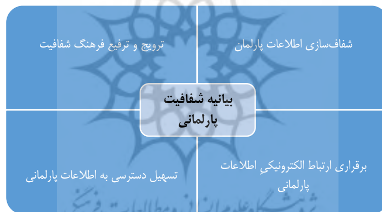
شکل ۱. بخش های اصلی بیانیه شفافیت پارلمانی (OpeningParliament, 2012)

این بیانیه شامل چهار بخش اصلی و ۴۴ ماده است. بخش های اصلی این بیانیه در شکل ۱ بیان شده است.