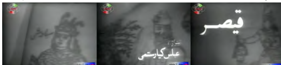
نمونه ۲: تن‌نگاشته در تیتراژ فیلم قیصر مسعود کیمیایی