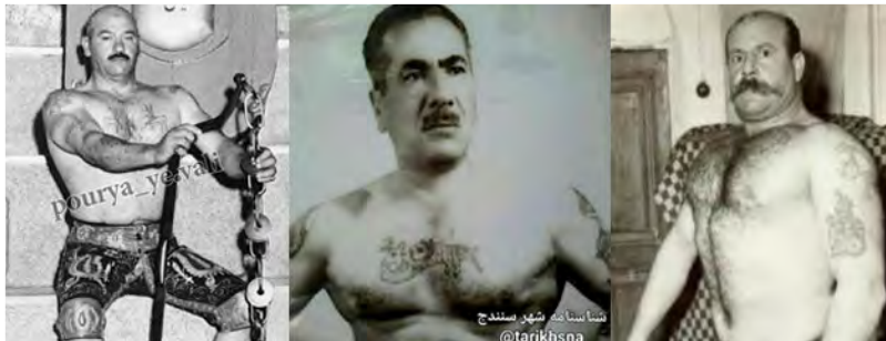
نمونه ۳: نقش خال روی تن ورزشکاران زورخانه

Example 3: The role of a mole on the body of Zurkhaneh athletes.