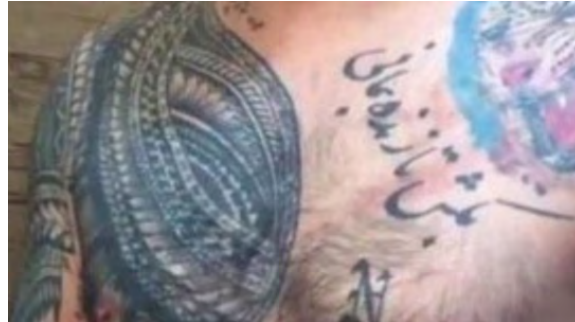
نمونه ۴: تن‌نگاشته (عبارت بکش تا زنده بمانی)