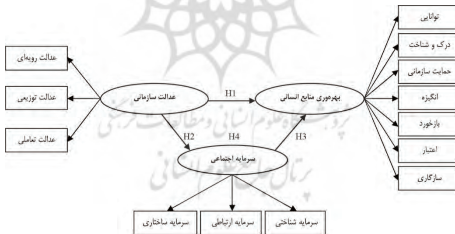
شکل ۱. مدل مفهومی پژوهش

هم چنین با توجه به نقشی که عدالت سازمانی ادراک شده بر بهره‌وری کارکنان دارد (فرضیه H1) و با توجه به نقشی که عدالت سازمانی ادراک شده بر سرمایه اجتماعی سازمانی دارد (فرضیه H2) و با توجه به نقشی که سرمایه اجتماعی سازمانی بر بهره‌وری کارکنان دارد (فرضیه H3) می‌توان فرضیه چهارم پژوهش را این گونه در نظر گرفت: سرمایه اجتماعی سازمانی در تأثیر عدالت سازمانی ادراک شده بر بهره‌وری کارکنان در شرکت گاز استان کرمان متغیر میانجی است. بر این اساس، مدل مفهومی پژوهش به شرح شکل ۱ ارائه شده است.