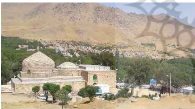
تصویر ۴. منظر آیینی امامزاده محسن و تلفیق آن با طبیعت، مرداد ۱۳۹۵ و در حال مرمت مجدد و بازسازی بنا، عکس: ریحانه خرم‌روی، ۱۳۹۶.

حرم مطهر از جمله سنی است که در این فضای آیینی هر ساله در زمان و مکان مشخص اجرا می‌شود (تصویر ۵). همین اتفاقات و رخداد‌های اجتماعی-آیینی-فرهنگی هستند که منجر به جذب گردشگر داخلی و خارجی به این فضا شده است. همانطور که در ابتدای بحث اشاره شد علاوه بر مکان مقدس امامزاده وجود طبیعت بکر، کوه‌ها و دره‌های پیرامون آن، چشمه‌سارها و رودهای فراوان و همچنین باغاتی که در پیرامون امامزاده وجود دارند، بخش سیاحتی-تفریحی و اقتصادی منطقه را تأمین می‌کنند. معمولاً گردشگرانی که به این منطقه سفر می‌کنند بازه زمانی سفرشان بین یک تا دو روز است. آن‌ها کنار زیارت به تفریح در طبیعت و چادرزنی در