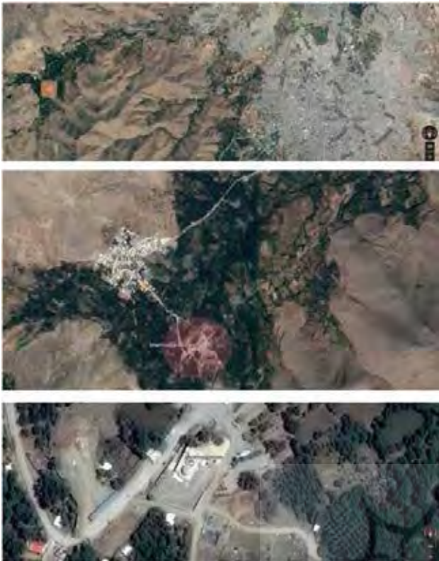
تصویر ۱. محل قرارگیری امامزاده محسن نسبت به شهر.

و حرم است. مقبره شامل دو بنای آجری نسبتاً کوتاه با گنبدی‌های مرتفع شلجی شکل هستند که ظاهراً از آثار دوره ایلخانی محسوب می‌شوند (گروسین، ۱۳۸۳، ۲۳). در جنگ ایرانیان و اعراب از بزرگان عرب نیز - چنانکه گفته‌اند - افرادی نظیر ابودجانہ انصاری (از صحابه رسول اکرم (ص))، ابوصالح تماتی، ابوسمیل و ابوکامل کشته شدند، که مدفن آنان در بقعه امامزاده کوه است (همان، ۲۶). از شواهد برمی آید که درهٔ ماوشان از همان دوران باستان مورد نظر سلاطین و امرا بوده و بقعه بر روی بنای خیلی قدیمی تری، احتمالاً متعلق به دوره ساسانی ساخته شده است، که می‌توانسته آتشکده‌ای باشد، زیرا در جایی ساخته شده است که اشعهٔ آفتاب هنگام طلوع به آنجا می‌تابد و این در ساخت بناهای مذهبی ایران باستان از اهم شرایط بوده است. ثانیاً بافت بنا و دو گنبد که صحن هر کدام بالاتر از دیگری است، دارای سه صفا است که می‌تواند نماد اندیشهٔ نیک، گفتار نیک و کردار نیک باشد. از سوی دیگر وجود نامجای «هشتادار» ۴ که به کوه‌های غرب روستای برفین (یا روستای امام زاده کوه) و بقعه امامزاده اطلاق می‌شود، می‌تواند مؤید این نظریه باشد (خرم‌روئی، ۱۳۹۶، ۴۹).