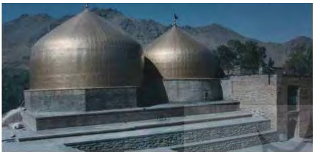
تصویر ۳. منظر آیینی امامزاده محسن و تلفیق آن با طبیعت، سال ۱۳۷۵ بعد از مرمت گنبدها، مأخذ: آرشیو میراث فرهنگی شهر همدان.