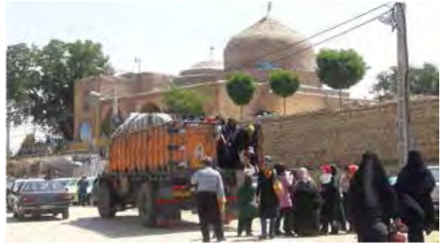
تصویر ۵. گردشگران مذهبی در امامزاده محسن شهر همدان، عکس: ریحانه خرم‌روئی، ۱۳۹۶.

تصویر ۶. مقبره امام زاده محسن شهر همدان و اعتقادات شهروندان در حوزه منظر آیینی (بخش نمادین و استعاره‌ی منظر آیینی) به همراه فعالیت‌ها و کنش‌های اجتماعی (بخش کنشی-اجتماعی منظر آیینی)، مأخذ: www.hamshahriphoto.ir