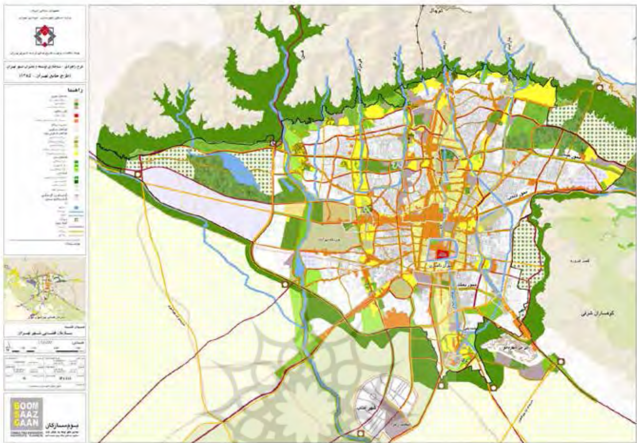
تصویر ۳. نقشه سازمان فضایی پیشنهادی شهر تهران.

جامع البته در مراتب بعدی طرح‌های شهری نیز دیده می‌شود و نگاهی گذرا به طرح‌های مصوب تفصیلی در مناطقی با پتانسیل حضور رودرها نشان از هرچه کم‌رنگ شدن ایده اولیه این شریان‌های حیاتی در شهر است؛ امری که تا رسیدن به مرحله عملیاتی تقریباً به‌طور کامل رنگ باخته و تنها شعاری از آن باقی مانده است. این سیر تطور در نهایت به پیشنهاد طرح موضعی-موضوعی در پیوست شماره ۴ سند طرح جامع ختم می‌شود که به معنای حواله‌دادن موضوع به تصمیم‌گیری‌های بعدی است.