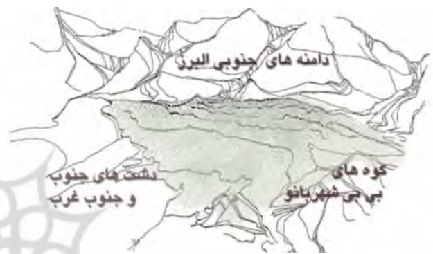
تصویر ۱. دوازده رودره اصلی شهر تهران که از دامنه‌های البرز جنوبی سرچشمه گرفته‌اند و موقعیت شهر تهران در ارتباط با کوه‌های اطراف.