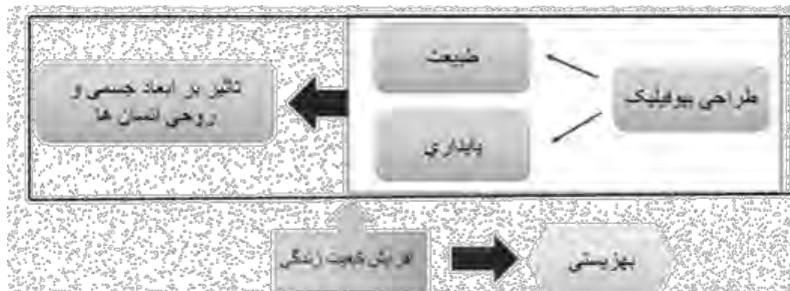
شکل ۲. ارتباط روانشناسی محیطی و معماری، (برداشت از منابع)

(هرشونگ، ۲۰۱۳). در نتیجه گیری مبحث دیگری از بررسی ها مشاهده شد که واحدهای همسایگی و اجتماعی در تبادل بیشتری با طبیعت هستند که جوامع همبسته تر و از تساوی بیشتری برخوردارند و وجود طبیعت به کاهش اختلافات کمک کرده است (Kellert, ۲۰۱۱).