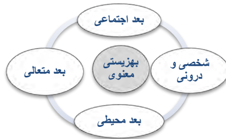
شکل ۲. ابعاد بهزیستی معنوی، (فرناند، رفی و چودهری، ۲۰۱۰)

و هویت فردی و هویت گروهی او را تقویت می‌کند (کلانسی، بالتزکارد، پراندر و ماهلر، ۲۰۱۵). هم‌چنین تعریفی که سازمان بهداشت جهانی از سلامت به عنوان حالتی از بهزیستی عنوان کرده عبارت از یک حالت آسودگی جسمی، روانی، اجتماعی است و تنها به نبود بیماری یا ناتوانی اطلاق نمی‌شود بلکه شامل سه محور جسم، روان و جامعه می‌شود (سازمان بهداشت جهانی، ۲۰۱۷). گنجاندن بهزیستی معنوی به عنوان یکی از ابعاد بهزیستی در تعریف سازمان بهداشت جهانی رایج شده است. فرناند، رفی و چودهری (۲۰۱۰) برای بهزیستی معنوی ۴ بعد پیشنهاد داده است: