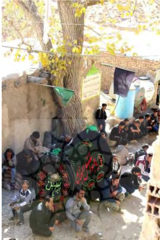
تصویر ۱۵: نخل روستای وش

در زیر نخل دو تیرک قرار دارد و برای حمل آن چهار نفر کفایت می‌کند. نخل را با نوای سنج و دهل و نوحه همراهی می‌کنند. مردان در پیش و زنان در پس آن هستند. جمعیتی حدود صد نفر ساده و بی‌آلایش.