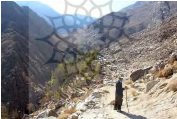
تصویر ۳: نمایی از روستای وش

بافت روستا سنتی و قدیمی است؛ مانند دیگر آبادی‌های کوهستانی این منطقه از جمله «ایبانه». برخی از عناصر بافت هم تاریخی است و به دوران قاجاری برمی‌گردد، اما مرمت و ساخت‌وسازهای جدید نیز کم‌وبیش در این آبادی به چشم می‌خورد (نک: تصویر ۴). برق‌رسانی به این روستا در سال ۱۳۹۱ صورت گرفته است.