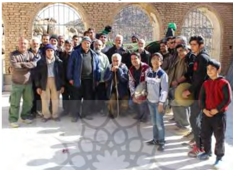
تصویر ۱۹: عکس یادگاری ابوزیدآبادی‌ها و وش‌ها با نخل

دامنه کرکس و کوهستان‌های اطراف وش می‌آیند، به نظر می‌رسد حضور در مراسم و تولیت و مرمت دو زیارتگاه مورد نظر، یادآور حضور مردم ابوزیدآباد در قرن‌های پیشین است که کوهستان کرکس محل بیلاقی آنان در زمان کوچ‌نشینی بوده است (نک: تصویر ۱۹).