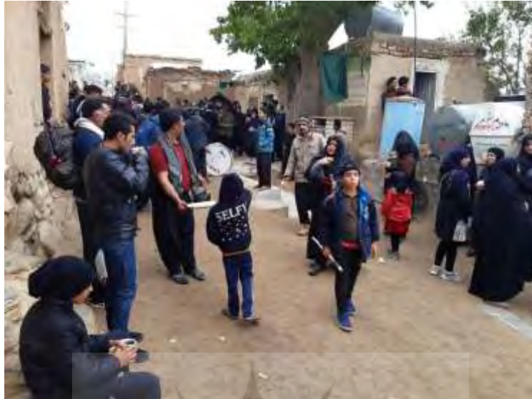
تصویر ۱۷: پذیرایی از مردم در سر زیارت