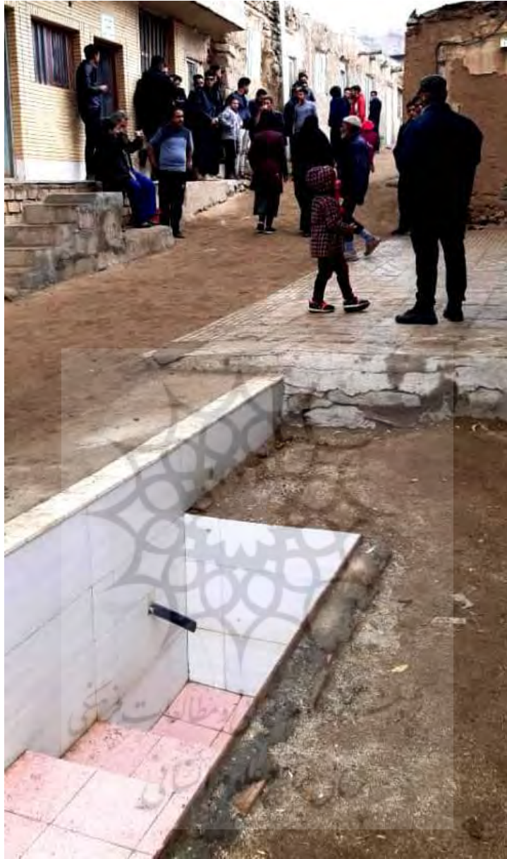
تصویر ۱۳: آب کم چشمه سر زیارت

در سر زیارت مسجدی هم هست که خیلی قدیمی نیست اما ضریحی مشبک یک سطحی چوبی در آن واقع است که به نظر از دوران قاجاری باشد و احتمالاً در همین کعبه کوچک نصب بوده است.