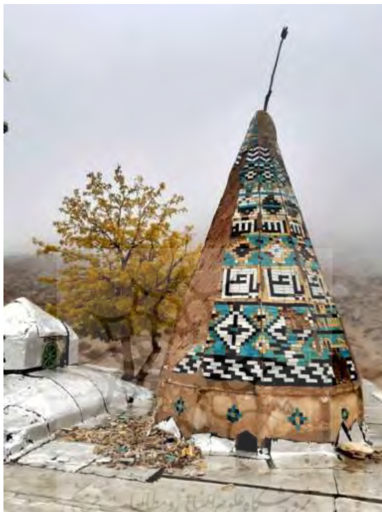
تصویر ۸: گنبد زیارتگاه اولیاءالله

دیواره‌های داخل بنا و ساختمان زیرگنبد و ورودی در سال ۱۳۸۷ خورشیدی کاشی‌کاری شده است که دارای تزیینات نقوش و کتیبه بر زمینه آبی پررنگ است. از اشیاء قدیمی زیارتگاه منبر چوبی کوچکی است که اکنون بلااستفاده در گوشه‌ای از صحن افتاده است. به‌رغم اینکه انتظار می‌رود در این‌گونه فرم‌های زیارتگاهی قبر در وسط بنا و زیر گنبد باشد، زیارتگاه فاقد هرگونه قبر یا مزار است و محور قداست در انتهای فضای گنبدخانه واقع است که عبارت است از پنجره‌ای مشبک به عرض تقریبی یک و ارتفاع دو متر که بر دیواره زیارتگاه قرار دارد و در واقع بر این ضریح کوچک چسبیده بر دامنه کوه است (نک: تصویر