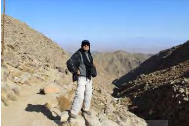
تصویر ۲: مسیر مالرو به طرف زیارتگاه‌های کوه سفید و روستای وش