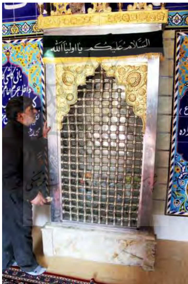
تصویر ۹: ضریح اولیاءالله

۹). به نظر می‌رسد در اینجا شکاف یا فرورفتگی وجود داشته مانند بسیاری دیگر از این گونه زیاراتگاه‌هایی از این دست که احتمالاً در آنجا چشمه‌ای کوچک وجود داشته که محور قدسی این مکان است. چنان‌که مسن‌ترها نقل می‌کنند در این زیارتگاه چشمه‌ای وجود داشته و آب آن پس از عبور از صحن از زیر پلی که هنوز در آن نزدیکی هویدا است، عبور می‌کرده، اما اکنون خشک شده است. اهالی بر پایه اسطوره‌ای که تعریف می‌کنند اعتقاد دارند که این ضریح محل غیبت ۳۵ تا ۷۲ نفر از فرزندان ائمه و اولیاء خدا است.