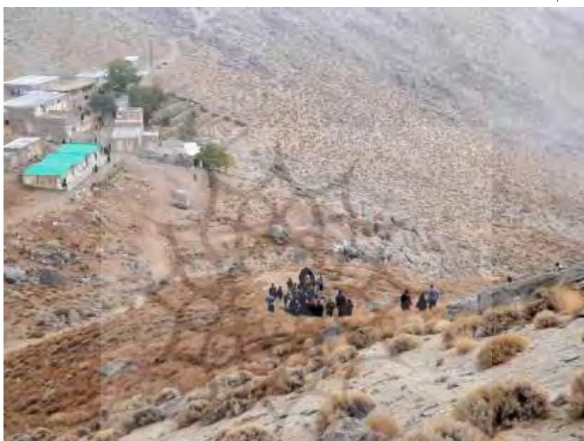
تصویر ۱۶: نخل برداری

می‌شوند، مردان در جلو و زنان در پس آن‌ها. نقش کودکان نیز در مراسم چشمگیر است و حتی این کودکان و نوجوانان هستند که بر طبل و دهل می‌کوبند. جمعیت نخل را پس از طی این مسیر صعب‌العبور نخل را به زیارتگاه کوه سفید که در رأس تپه‌ای بلند قرار دارد می‌برند، در آنجا توفقی کرده، ذکر مصیبتی خوانده می‌شود و عزادارن آداب زیارت را به جا آورده و سپس نخل را از به سر زیارت آورده و در آنجا توقف می‌کنند (نک: تصویر ۱۶)؛ ذکر مصیبتی خوانده می‌شود و از مردم با قهوه و شیرینی پذیرایی می‌شود (نک: تصویر ۱۷).