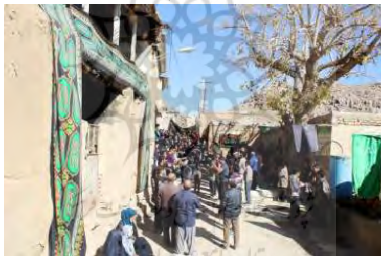
تصویر ۱۸: پایان مراسم در سر زیارت