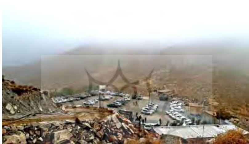
تصویر ۱: گذار؛ پارکینگ در بالادست روستای تتماج

روستای «وش» یکی از روستاهای دورافتاده، با فاصله ۵۰ کیلومتری از مرکز شهرستان «نطنز» است. این روستا از طرف کاشان مسیر ماشین‌رو ندارد و برای رفتن باید به روستای «تتماج» رفت و پس از طی مسافتی در بالادست تتماج، وسیله نقلیه را در جایی به نام «گذار» کنار چشمه‌ای که آنجاست و امروزه پارکینگی با امکانات اولیه آب و برق و نگهبان دارد، پارک و سپس پیاده در دامنه کوه به سمت آبادی حرکت کرد (نک: تصویر ۱).