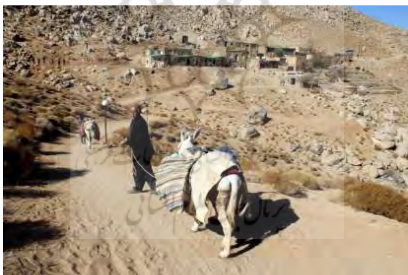
تصویر ۵: بیلاق اهالی به طرف کاشان در میانه فصل پاییز

در ایام محرم و صفر و همان‌طور ماه مبارک رمضان و شب‌های قدر، جمعیت روستا فزونی می‌یابد. جالب این است که در این آبادی مسجد جامع هم وجود دارد و بنا به گفته اهالی، تا چند سال پیش، نماز جمعه هم اینجا خوانده می‌شده است. به جز آن، روستا حسینیه هم دارد