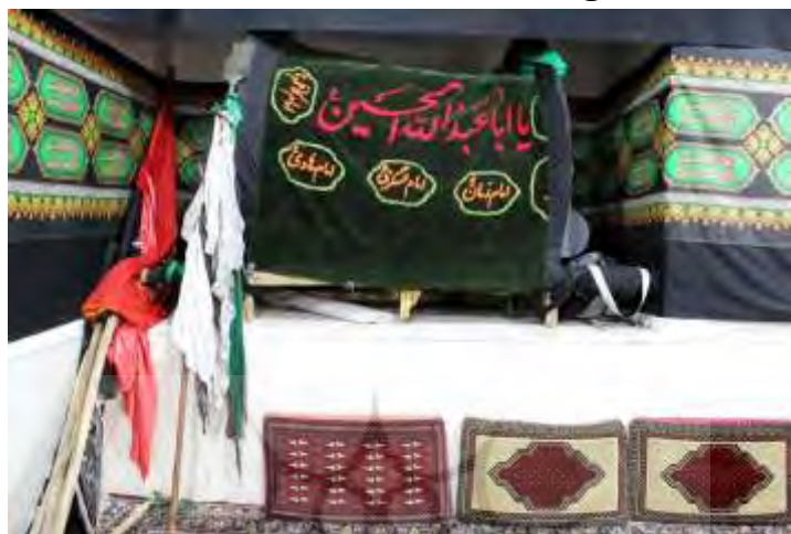
تصویر ۶: حسینیه روستای وش

که به تازگی مرمت شده و در آنجا «نخل» و علم‌های دیگر را گذاشته‌اند و عکس سه تن از شهدای جنگ ایران و عراق که اصالت وش‌ی دارند (نک: تصویر ۶). همچنین مسجد کوچکی در بالای صخره آب‌چکان واقع در جنوب غرب آبادی قرار دارد.