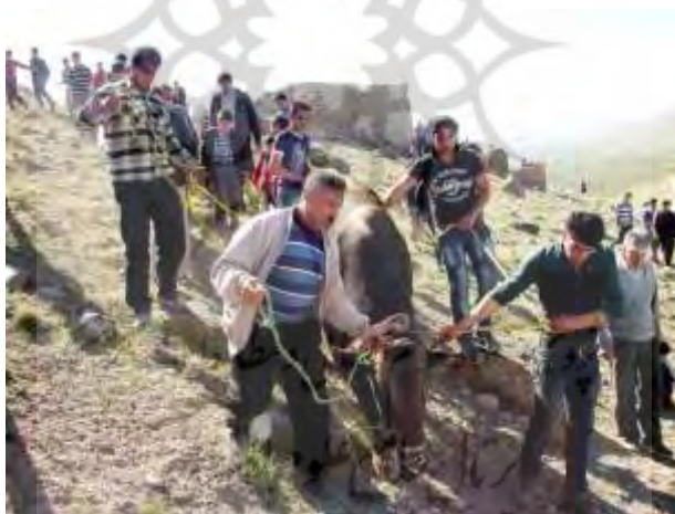
تصویر ۲۰: آیین قربانی گاو در اسفنجان

مردم اسفنجان، روستایی از توابع شهرستان اسکو در ۳۰ کیلومتری تبریز، هرساله در اولین پنجشنبه‌ای که ۳۶ روز از نوروز گذشته باشد، آیینی ایرانی برگزار می‌کنند که سابقه‌ای طولانی دارد و به طلب باران انجام می‌شود. (تصویر ۲۰).