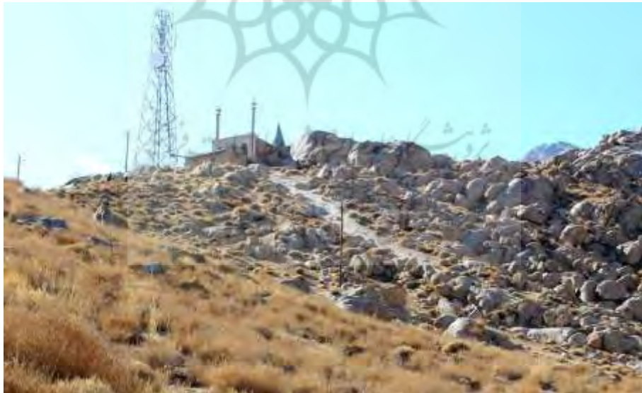
تصویر ۱۰: نمای زیارتگاه کعبه کوچک

این زیارتگاه در رأس کوه سفید قرار دارد شامل فضایی در پایین که امروزه انباری است و سقف آن صحن کوچک زیارتگاه است. همچنین ایوان و گنبدخانه کوچک که در قسمت داخلی مزین به کاشی‌های آبی‌رنگ کتیبه‌دار است که در دهه‌های اخیر ساخته شده و بنای گنبد مخروطی فیروزه‌ای که کمی قدیمی‌تر است و ممکن است هم‌زمان با گنبد زیارتگاه اولیاءالله، یعنی حدود سال ۱۳۳۳ خورشیدی ساخته شده باشد (نک: تصویر ۱۰). دو گلدسته با تزیینات کاشی فیروزه‌ای در جانبین این بنای کوچک، جدیدترند. پنجره مشبک یا ضریح زیارتگاه نیز به ارتفاع تقریبی دو و عرض یک و نیم متر چسبیده به صخره کوه است و یک سطح دارد. پنجره مشبک چوبی در سر زیارت نگهداری می‌شود که احتمالاً پنجره قدیمی همین کعبه کوچک است. وقف‌نامه‌ای در دیواره بنا نصب است که نشان می‌دهد در سال ۱۳۴۶ شمسی این بنا تعمیر شده و گویا بخش زیادی از بنای فعلی نیز کم‌وبیش مربوط به این دوران است. با این اوصاف در دهه اخیر نیز بخش‌های داخلی زیارتگاه کاشی‌کاری شده است همانند زیارتگاه اولیاءالله. در صخره‌ای که محل قداست است و ضریح بر آن چسبیده آثار رسوب آب نیز مشاهده می‌شود دلیلی بر وجود چشمه‌ای مقدس در این مکان که به خشکی گراییده و تنها خاطره‌ای از قداست آن برجای مانده است (نک: تصویر ۱۱).