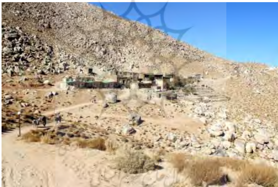
تصویر ۱۲: نمایی از سر زیارت

با وجود این به نظر می‌رسد تعدادی از بناهای سر زیارت (زائرسرا) که در نقطه‌ای پایین‌تر از زیارتگاه است مربوط به دوران قاجاری و پهلوی باشد، هرچند ساخت‌وسازهای جدید در آن زیاد است و اتاق‌هایی برای اقامت شبانه زائران در ایام مختلف سال در نظر گرفته شده است و امکانات آب و برق و پخت‌وپز نیز کم‌وبیش فراهم است (نک: تصویر ۱۲).