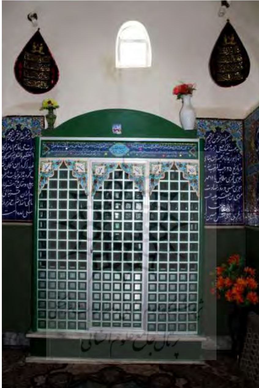
تصویر ۱۱: نمای داخلی زیارتگاه کعبه کوچک