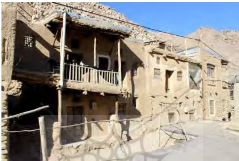
تصویر ۴: بافت روستای وش

۵۰ نفر هم می‌رسد. با آغاز موسم سرما اهالی بارهای خود را بر الاغی نهاده و از طریق گذار تتماچ بیلاق را تمام و قشلاق می‌کردند (نک: تصویر ۵).