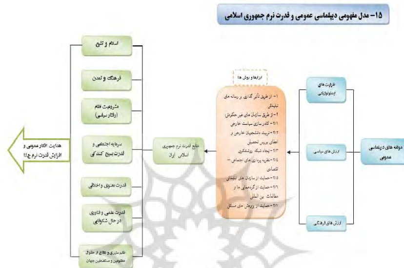
مدل مفهومی دیپلماسی عمومی و قدرت نرم جمهوری اسلامی ایران

استقبال را در جای دیگر جستجو کرد که همان نفوذ معنوی و به عبارت دیگر قدرت نرم جمهوری اسلامی ایران است (www.kokabehedayatblogfa.com).