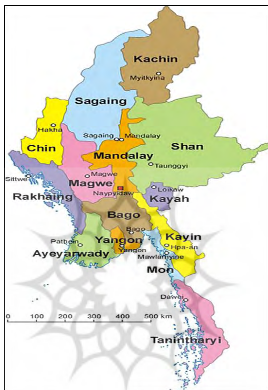
نقشه ۲: تقسیمات سیاسی کشور میانمار

باطل اعلام کردند. راهبان بودایی یکی از عوامل اصلی در تظاهرات سال ۲۰۰۷ علیه رهبران نظامی برمه بودند. پس از وقوع ناآرامی‌های پراکنده در اعتراض به افزایش قیمت سوخت بود که راهبان بودایی بزرگ‌ترین تظاهرات ضد دولتی پس از سال ۱۹۸۸ میلادی را ترتیب دادند که برای چند روز اوضاع را در رانگون، پایتخت و سایر مراکز جمعیتی ملتهب کرد (Nejandi Manesh and Firoozi, 2018).