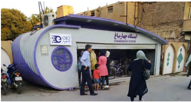
تصویر ۹. ایستگاه چهارباغ برای امانت دوچرخه در خیابان چهارباغ عباسی. عکس: سودابه قلی‌پور، ۱۳۹۸.