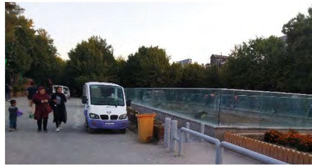
تصویر ۸. مسیر تردد خودروی برقی در خیابان چهارباغ عباسی.

و اقداماتی را که برای ارتقای این خیابان مؤثر دانسته‌اند، زیرشاخص‌هایی برای چهار شاخص کالبدی، اجتماعی، اقتصادی و زیست‌محیطی استخراج شده است.